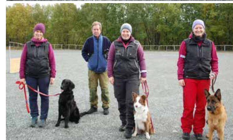
Bilder fra brukshundprøvene.