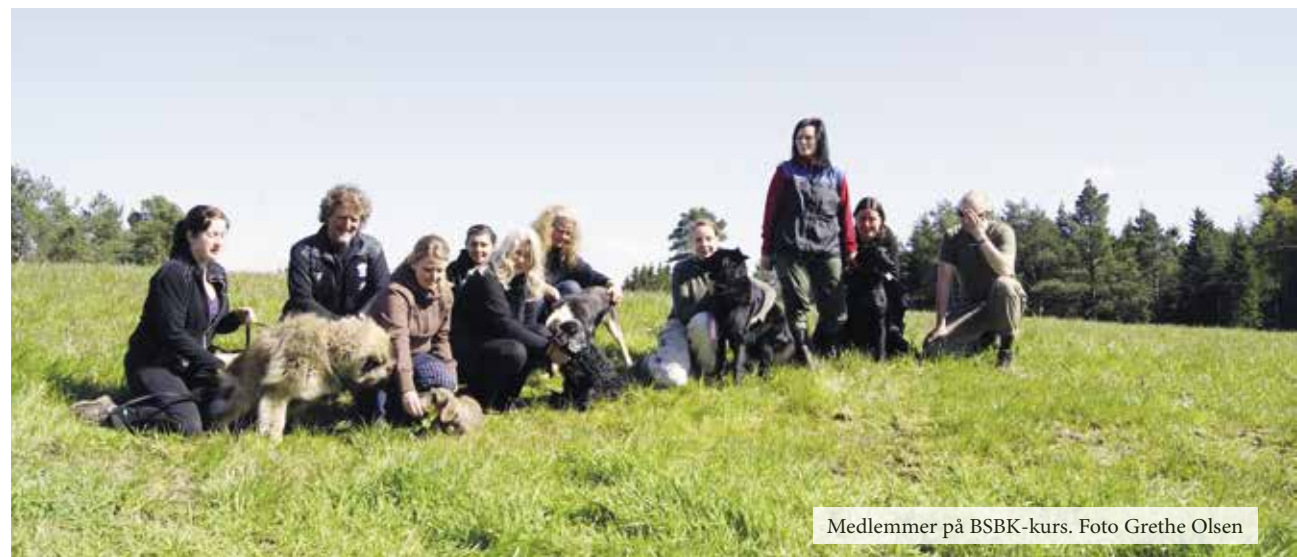
Medlemmer på BSBK-kurs. Foto Grethe Olsen

Du finner oss på Danmarks plass! Fjøsangerveien 30A, 5053 Bergen