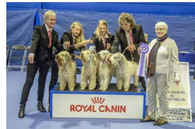
BESTE OPPDRETTERGRUPPE Lørdag 29.09. Dommer: Hassi Assenmacher-Feyel, Tyskland