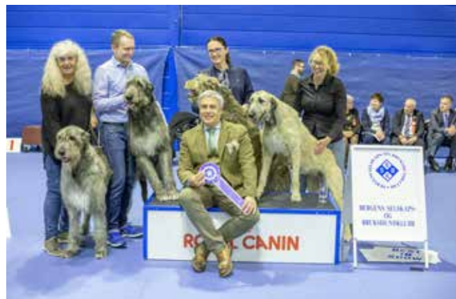
BESTE OPPDRETTERGRUPPE Søndag 30.09. Dommer: Tamas Jakkel, Ungarn