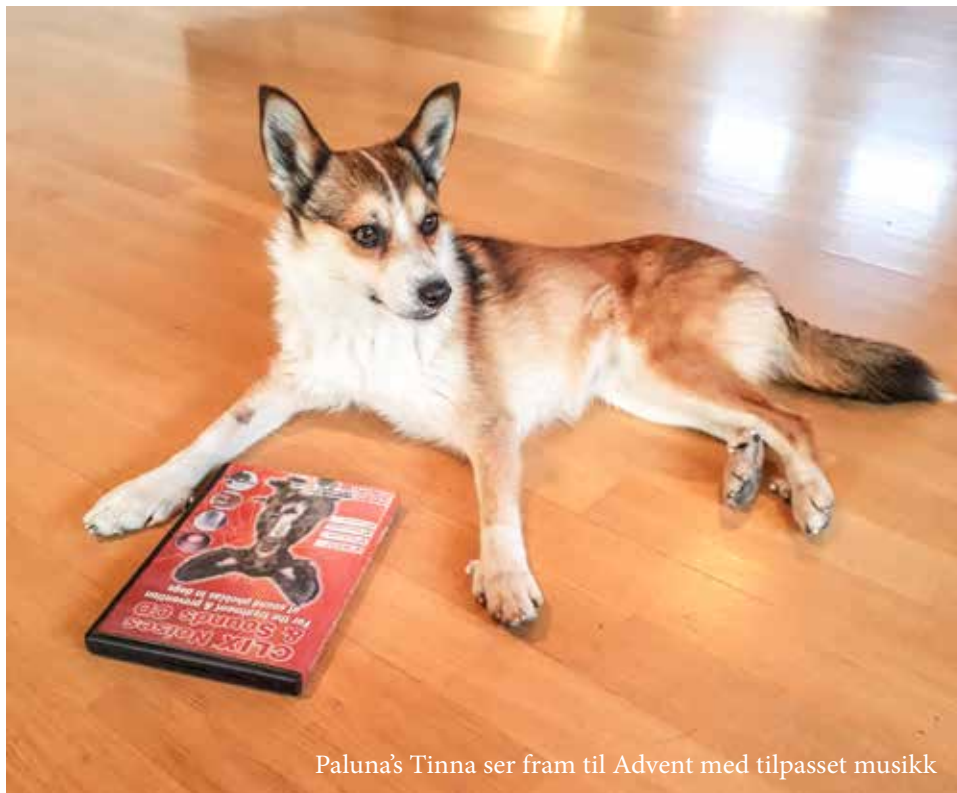
Paluna's Tinna ser fram til Advent med tilpasset musikk

Har du prøvd å venne hunden din til høye smell, raketter og uvær vha lyd på CD? Jeg må tilstå jeg var litt skeptisk, men det har endret seg.