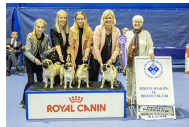
BESTE AVLSGRUPPE Lørdag 29.09. Dommer: Hassi Assenmacher-Feyel, Tyskland