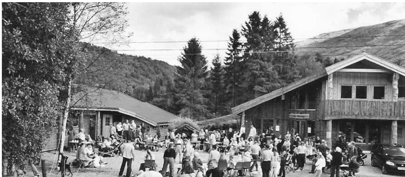
Bildet er fra vår årlige "Åpen Dag"

ALT PÅ ET STED - KUN 20 MIN FRA BERGEN SENTRUM ET SPENNENDE MILJØ MED HYGGELIG ATMOSFERE - OMSORG MED DYRENE I FOKUS -