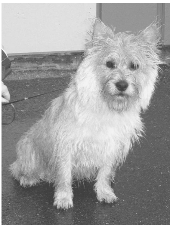
Veldig våt lydighetshund på kurs

Med bakgrunn i vedtak på årsmøtet er det satt ned en gruppe som skal se på muligheten for å finne et eget område som BSBK medlemmene kan disponere fritt til alle våre hunderelaterte aktiviteter.