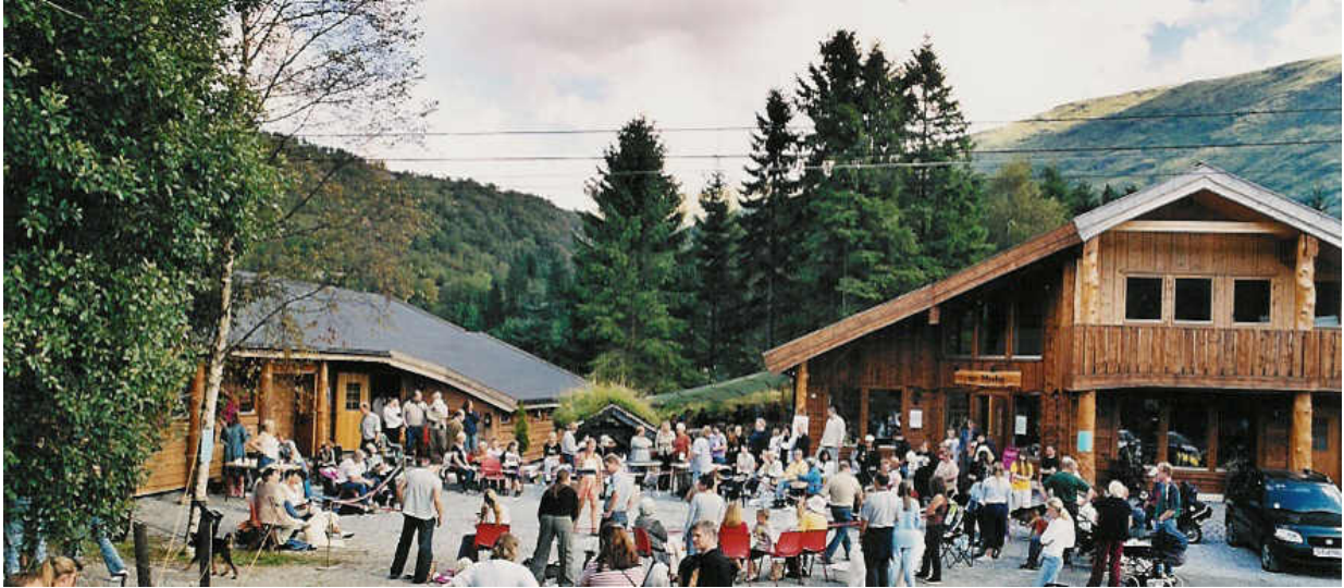
Bildet er fra vår årlige "Åpen Dag"

ALT PÅ ETT STED - KUN 20 MIN FRA BERGEN SENTRUM ET SPENNENDE MILJØ MED HYGCELIG ATMOSFÆRE - OMSORG MED DYRENE I FOKUS -