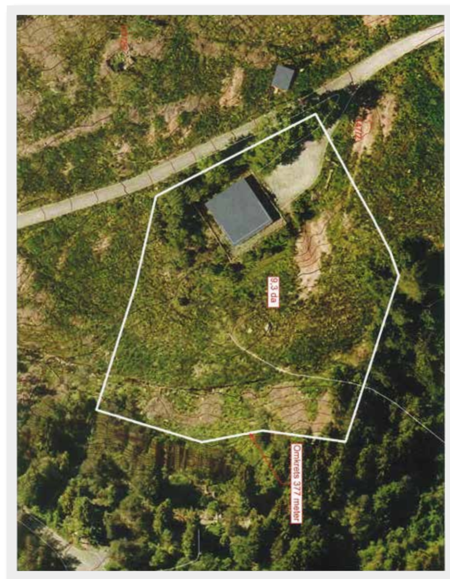
Luftbilde av området i Kanadaskogen ved Tennebekk som en regner med vil bli avsatt til friområde for hunder.

(Utdrag artikkel i Bergens Tidende supplert med nyere opplysninger)