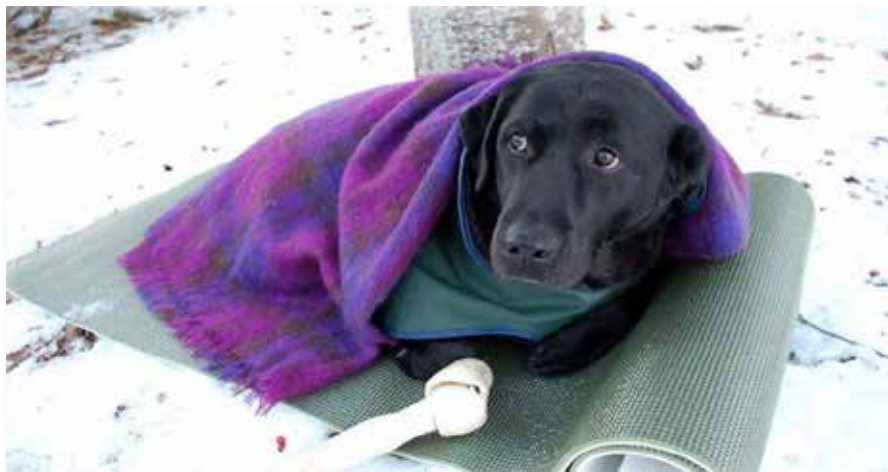
Labradoren Maja er godt kledd i kulda, Foto: Kirsten Mcdonagh/NRK