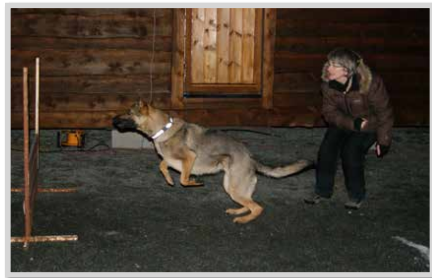
Fra onsdagstreningen på Myrbø, Lille Wagtskjold og Stella.

På bildene er det BKKs leder som engasjerer seg og hjelper Stella å hoppe over hinderet.