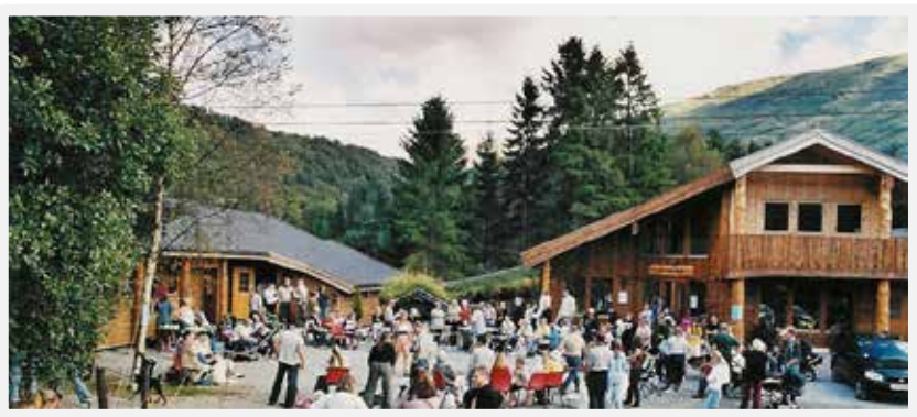
Bildet er fra vår årlige "Åpen Dag"

ALT PÅ ETT STED - KUN 20 MIN FRA BERGEN SENTRUM ET SPENNENDE MILJØ MED HYGGELIG ATMOSFERE - OMSORG MED DYRENE I FOKUS -