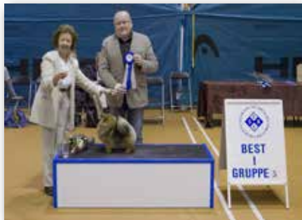
GRUPPE 5 – Dommer: Arne Foss, Norge.