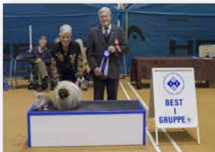
GRUPPE 9 – Dommer: Norman Deschuymere, Belgia.