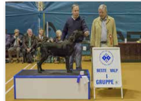
GRUPPE 8 – VALP – Dommer : Carl-Gunnar Stafberg, Sverige.