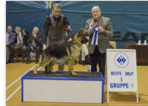
GRUPPE 1 – VALP – Dommer: Arne Foss, Norge.