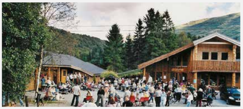
Bildet er fra vår årlige "Åpen Dag"

ALT PÅ ETT STED - KUN 20 MIN FRA BERGEN SENTRUM ET SPENNENDE MILJØ MED HYGGELIG ATMOSFERE - OMSORG MED DYRENE I FOKUS -