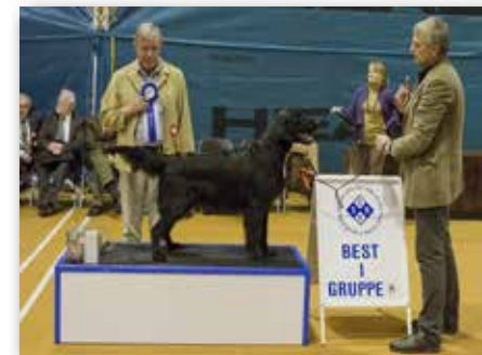
GRUPPE 8 – Dommer: Carl-Gunnar Stafberg, Sverige.