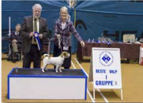
GRUPPE 3 – VALP – Dommer: Dominic Harris, Irland.