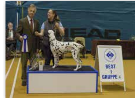
GRUPPE 6 – Dommer: Antonio Di Lorenzo, Italia.