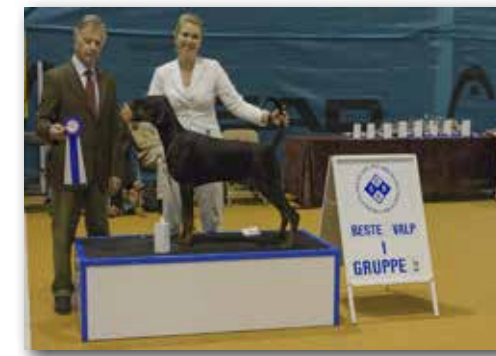
GRUPPE 2 – VALP – Dommer: Antonio Di Lorenzo, Italia.