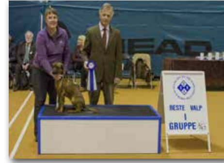
GRUPPE 4/6/7 – VALP – Dommer: Antonio Di Lorenzo, Italia.