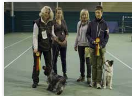
KLASSE 1 – Dommer: Aud-Liv Nes Eide, Norge.