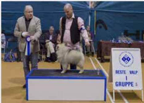
GRUPPE 5 – VALP – Dommer: Arne Foss, Norge.