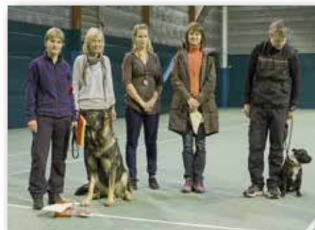
KLASSE 2 – Dommer: Aud-Liv Nes Eide, Norge.