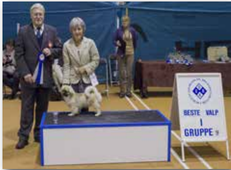
GRUPPE 9 – VALP – Dommer: Norman Deschuymere, Belgia.