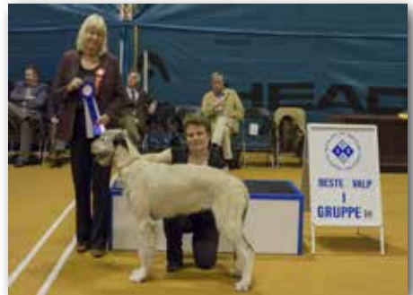
GRUPPE 10 – VALP – Dommer: Ann-Christin Johansson, Sverige.