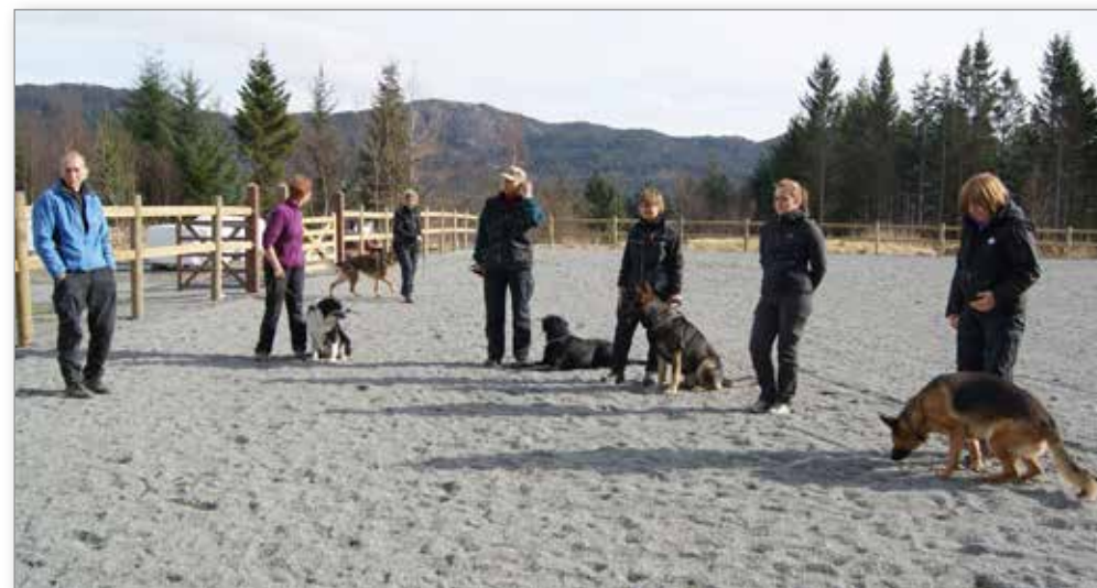
Deltakerne på NBF bruksprøven, våren 2013