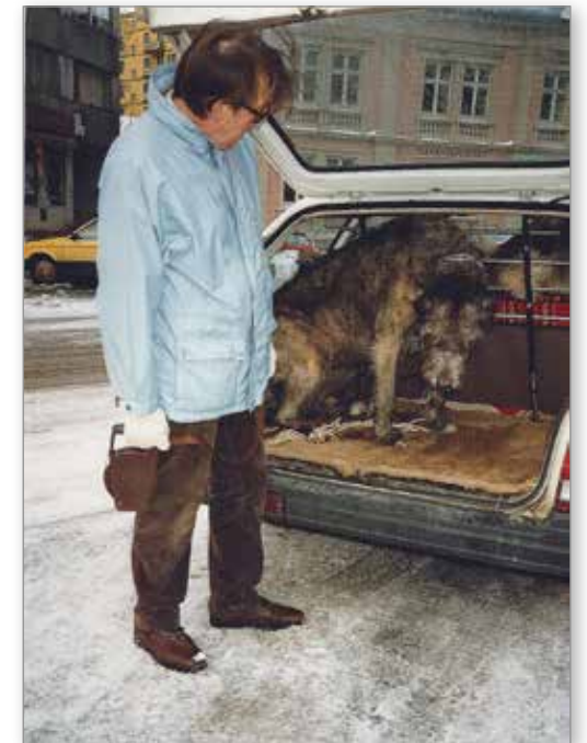
Ny bil er endelig godtatt ...

å hoppe inn i det ekle bakrommet, trass i myke tepper på golvet. Etter å ha lokket og mast og vært streng i stemmen, gikk vi til det drastiske skrittet å late som om vi ville dra på tur uten henne –for turer i marka elsket hun. Vi lot bakhjørna stå åpen