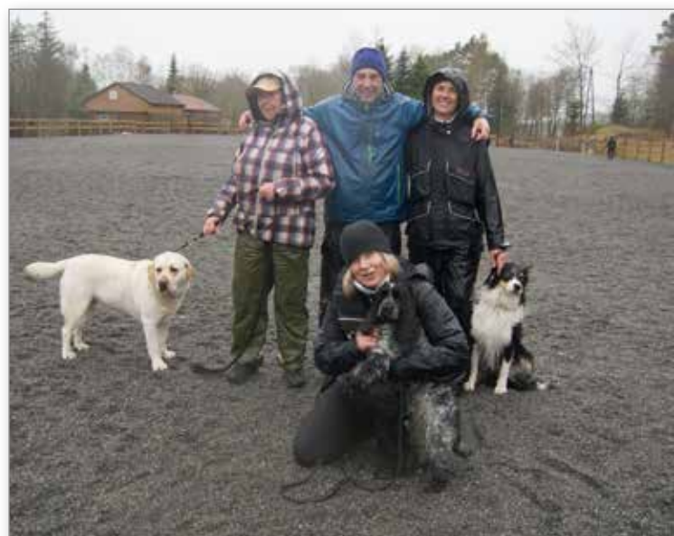
Deltakere i Klasse 2