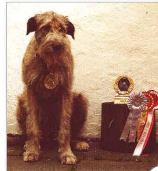
Utstilling er pyton ...

"Din lille Vige ble både BIR og BIG"! Javel? – det sa meg jo ikke noe særlig akkurat da – som fersk hundeeier var jeg ikke bevandret i utstillingslivets irranger. Men såpass skjønnte jeg at det var andre enn meg som syntes at min lille prinsesse var verdens deiligste ulvehund – selvfølgelig! Sløyfer og rosetter fikk hun også,