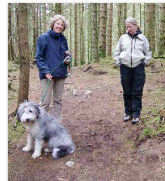
Molly er fornøyd etter økten