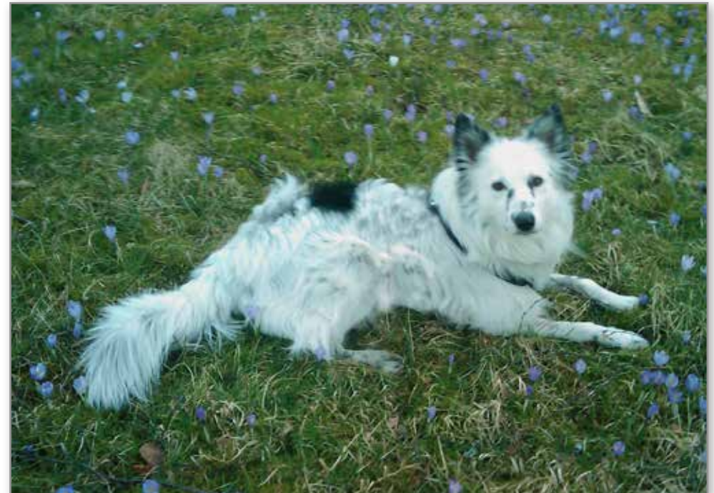
Scott nyter våren og markblomstene som kommer