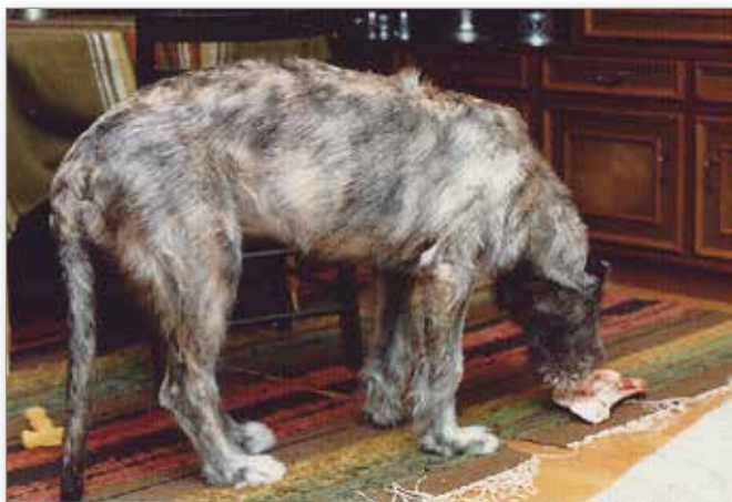
Ingen problemer med å forsyne seg fra matbordet ...

Det er mangt en valp må venne seg til og lære i den nye heimen sin. Mellom første og andre etasje har vi en lang, bratt trapp, og oppdretterne hadde gitt beskjed om at valpen måtte bæres i trapper den første tida. Dette var jo litt av en utfordring, siden Vige ble tyngre for hver uke som gikk. I et ubemerket øyeblikk trillet hun ned