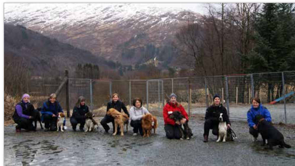
Deltakerne på bronsemerkeprøven, våren 2013