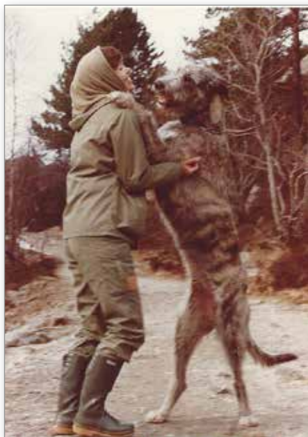
Stor hund, men bare vennlig

Vige var ingen vakthund – verken av rase eller natur. I valpetida var hun da heller ikke