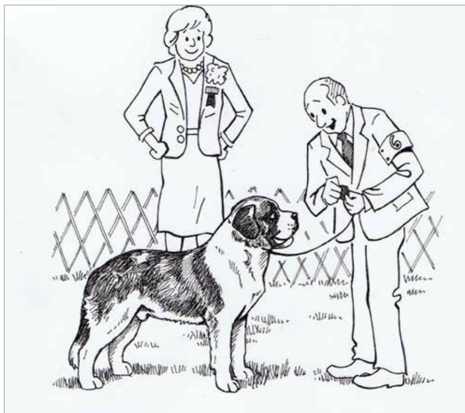
Dømmer dommerne «tryner» eller kvalitet på hundene?

Nå er det IKKE slik at jeg sier at man ikke skal stille ut sine «helt greie» hunder. De fleste, inkludert meg selv, har gjort og gjør det, og har stor glede av det. Mange «helt greie» vinner både cert og blir champions. Og de trengs for å holde bredde i avlen. Men du må også tåle at du ganske ofte blir stående bak de som velger kun kvalitet. For de som både