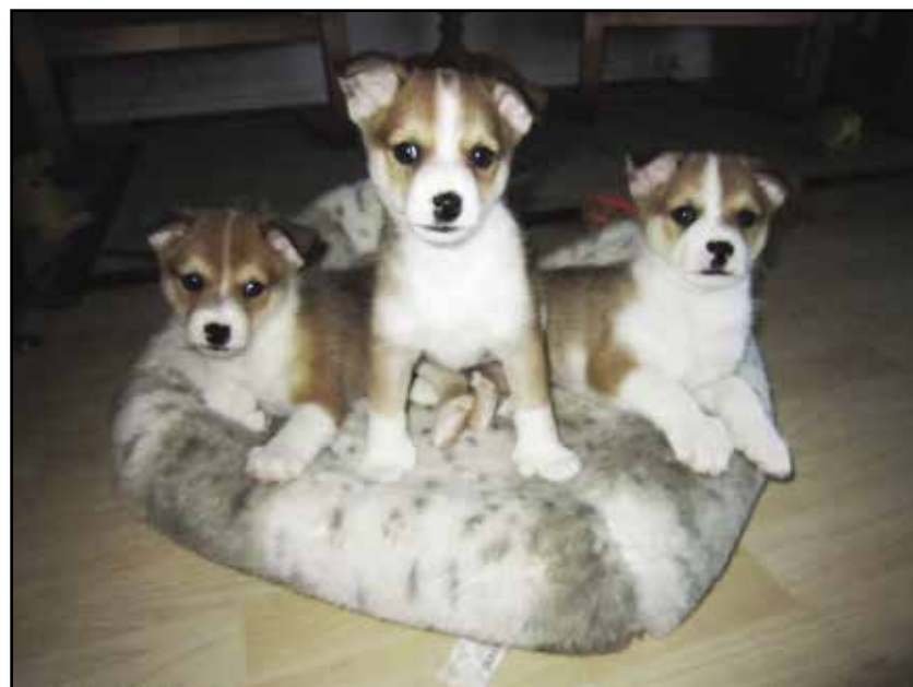
Norsk Lundehund valper, Værøy-kullet fra Kennel av Vollakloa. Fra v: Værøy-Drotten, Værøy-Daga og Værøy-Dage.