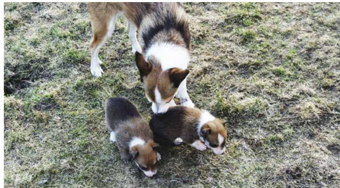
Treffe andre: Disse valpene er ute sammen med bestemor mens mamma får en fristund

blir født. Selv om valpene ikke kan se eller høre, har de god luktesans, og føler både kjærtegn, kulde og varme. Varsom håndtering av valpene, slik at de kan begynne å bli kjent med lukten av mennesker, og hvordan det føles å bli løftet opp og holdt inn til en menneskekropp, er en grunnleggende og viktig forutsetning for at valpen skal bli en vennlig og omgjengelig hund når den blir voksten.