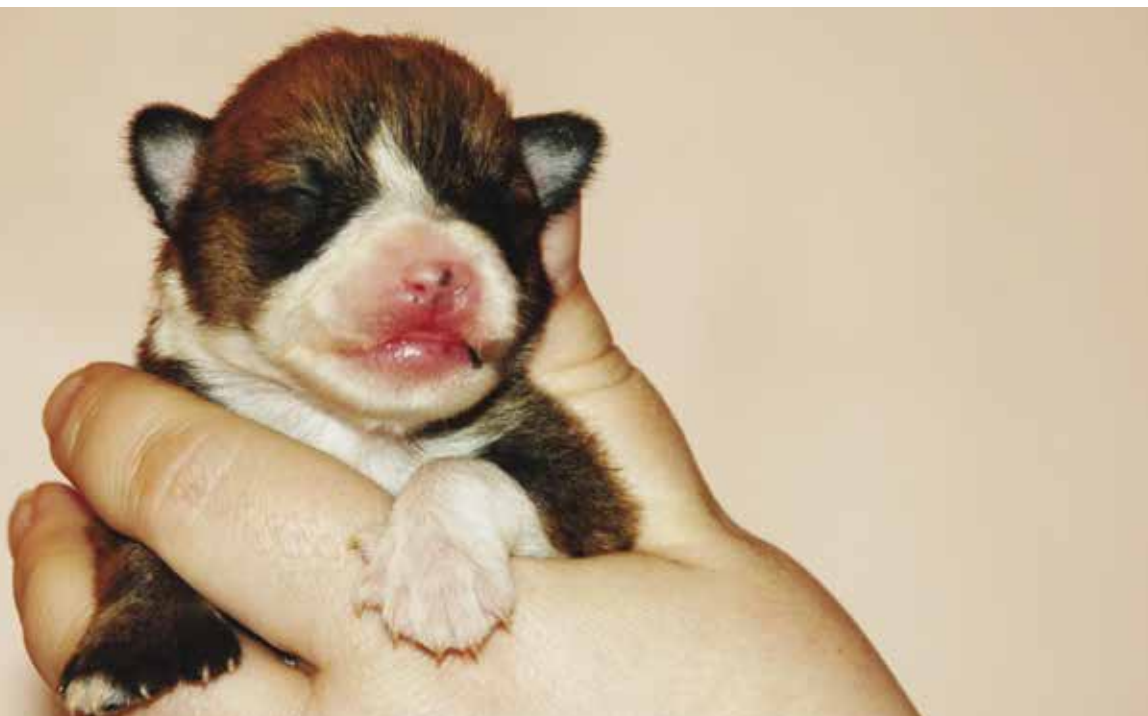
Håndtering: Det er viktig å venne valpene til å bli løftet og håndtert allerede som nyfødte

Av Solveig B. Steinnes