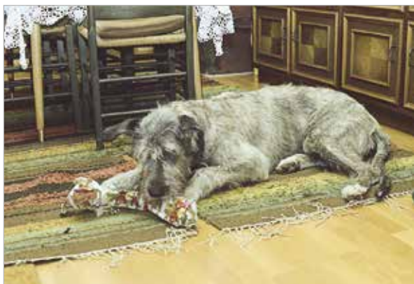
Bra finne-lek - godbitene passer til ulvehunder!