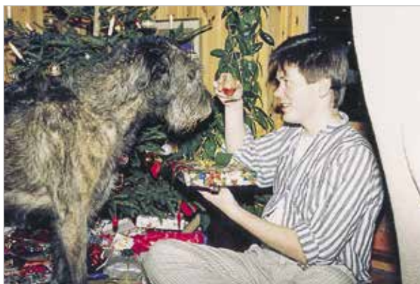
Er dette en ny finne-lek?