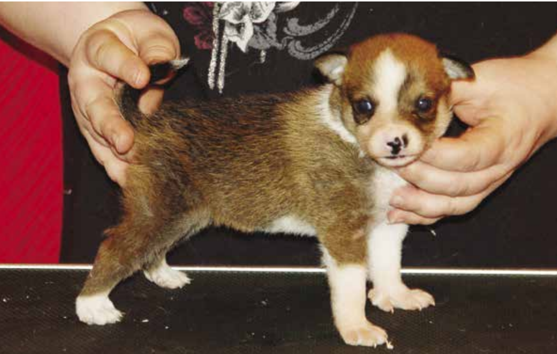
Bordtrening: Den skal tidlig krøkes som god utstillingshund skal bli

Når valpene er blitt omtrent en måned, er det på tide å ta dem med ut. Enten det er sommer eller vinter må oppdretteren sørge for at valpene får være utendørs en stund hver dag. Det er nå grunnlaget for en renslig hund legges. Og ikke skyld på været. Valper er vannfaste, og tåler både frost og snø, selv om de ikke bør være lenge ute i mange kuldegrader. En overbygde veranda vil være et godt hjelpemiddel for å kunne ha valpene ute hver dag. De fleste valper venner seg utrolig fort til å være utendørs, og de elsker det.