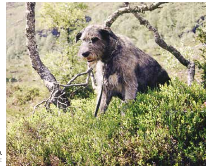
Godbitene ligger jo alt for høyt opppe!

En annen inne-aktivitet som ble anbefalt, var å lære hunden til å krype på buken. Det er kanskje mest et "sirkusnummer", men poenget var at det krever samspill av hode og muskler. Denne leken satte imidlertid Vige aldri pris på. Hvis en tilstrekkelig fristende godbit dingle foran nesa hennes, bukserte hun den store kroppen sin noen centimeter framover. Men ved neste forsøk ga hun opp og ble liggende paddeflat og glante forurettet på meg. "Hvorfor må jeg gjøre noe så dumt og nedverdiggende?" sa blick og holdning. Da motiverte ikke engang leverbiter.