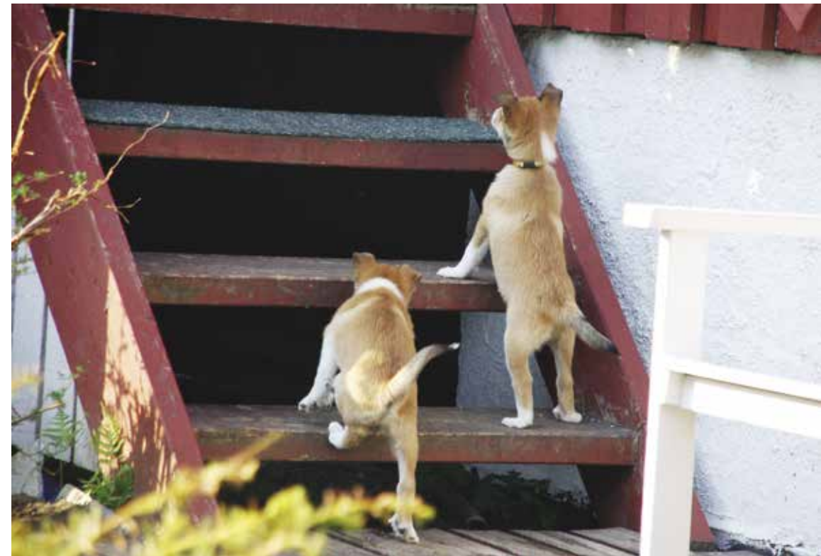
Mestring: Å gå i trapper er noe alle hunder må lære. Jo før desto bedre

Valpen må selvfølgelig fra første stund få leker og andre gjenstander å bite i eller snuse på. Ettersom den blir eldre, og kommer ut av huset, må den få se og snuse på alt det rare den kan bli utsatt for senere i livet. Sykler, ski, biler, flagg, klesvask, tepper som henger til lufting, hester og andre store husdyr, store fremmede hunder, alt må valpen få møte, ha kontakt med og venne seg til. Det er bare fantasien som setter grenser for hva valpene bør være med på. Ikke vær redd for at valpen skal bli smittet av noe fra fremmede dyr. Det er lite smittsom sykdom på