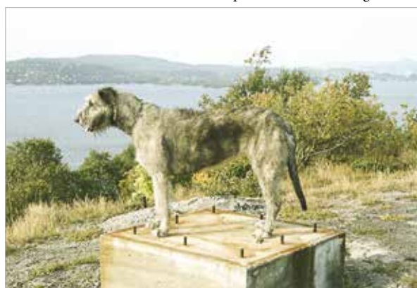
Dette var et passende sted å finne godbiter!

idealet om du ville ha en harmonisk, lydig og problemfri hund.