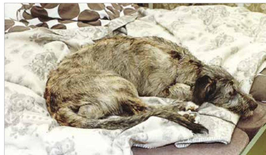
Hode-jogging tar på kreftene

At den mentale "jogginga" også hadde hatt den tiltenkte effekten, fikk jeg demonstrert når vi kom hjem fra turen. Da pilte Vige ned på soverommet, der hun med et fornøyd sukk krøllet seg sammen på matmors myke dyne og sov i mange timer – helt til det var tid for en rask kveldstur.