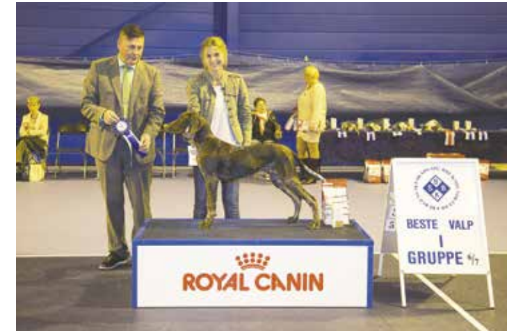
GRUPPE 6/7 - VALP - Dommer: Rune Fagerström, Finland.