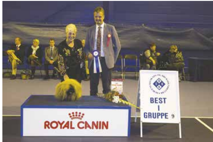
GRUPPE 9 - Dommer: Carsten Birk, Danmark.