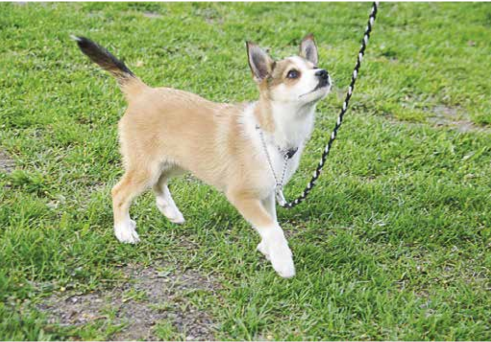
GÅ I BÅND: Hvis hunden skal gå pent i bånd kreves det at du har kontakt med hunden din. Denne valpen har lært å holde øyekontakt, og kikker opp på eieren når den er i bånd.

ting, så ikke gjør den feilen å bruke navnet som innkallingskommando. Det forvirrer bare hunden.