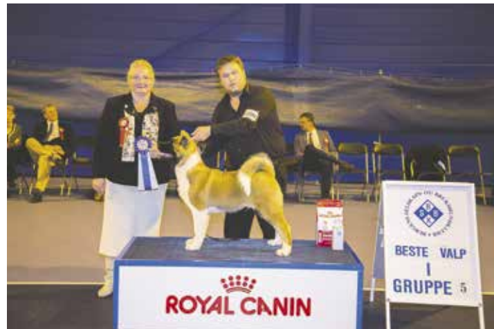
GRUPPE 5 - VALP - Dommer: Zorica Salijevic, Sverige.