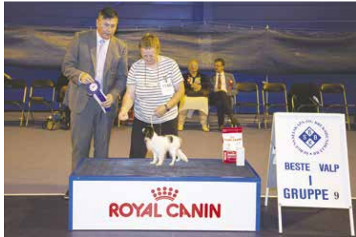
GRUPPE 9 - VALP - Dommer: Rune Fagerström, Finland.