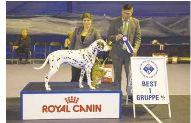
GRUPPE 6 - Dommer: Rune Fagerström, Finland.