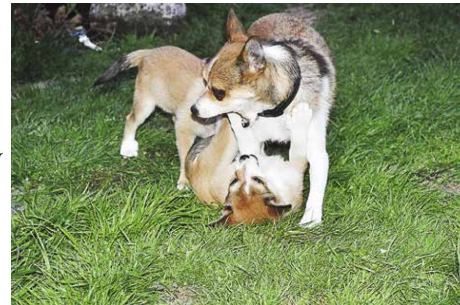
BITEHEMMING: Når valper leker med hverandre biter de i labber og ører. Gjør det vondt, sier de fra med et lite hyl. Det går lett å lære valpen å la være å bite for hardt hvis vi gjør det samme.

Små valper har ennå ikke lært seg at det gjør vondt når