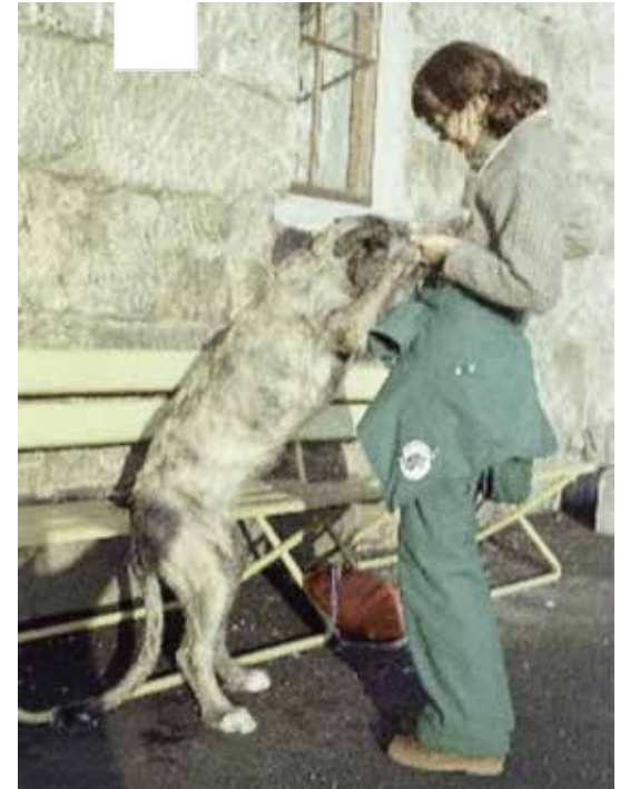
Må lære at ikke alle liker hunder som hopper opp.

Om Vige overskuet alle de lydighetskravene matmor kom til å stille henne overfor i tida framover, er vel tvilsomt. Selvfølgelig måtte jeg opptre slik at hun forsto at jeg var flokkleder, og det kunne innebære både ”nei” og ”fy” og kanskje noen mer håndgripelige metoder. For det var mangt en valp i fjortis alder måtte lære seg: komme på innkalling trass i spennende lukter å utforske; forstå at ”vent” eller ”bli ” betydde at det skulle skje NÅ, og ikke når det passet henne; bli flinkere til å gå rolig i kobbelen, slik at matmor slapp å henge langflat etter henne; og - ikke minst - slutte å vise sin vennlighet altfor demonstrativt - det er ikke alle som setter pris på å få et par ulvehund labber rundt halsen og en stor våt tunge over hele fjeset. Denne atferden måtte reserveres for matmor og gemalen og andre veldig nære og kjære som satte pris på slike kjærlighetserklæringer! Men hovedsaken var vi enige om: nemlig at det måtte være