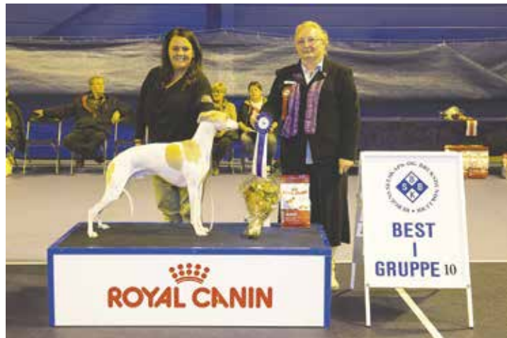
GRUPPE 10 - Dommer: Zorica Salijevic, Sverige.