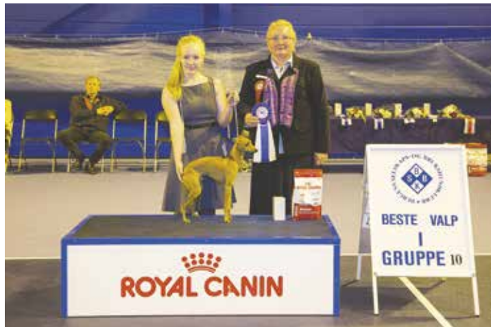
GRUPPE 10 - VALP - Dommer: Zorica Salijevic, Sverige.