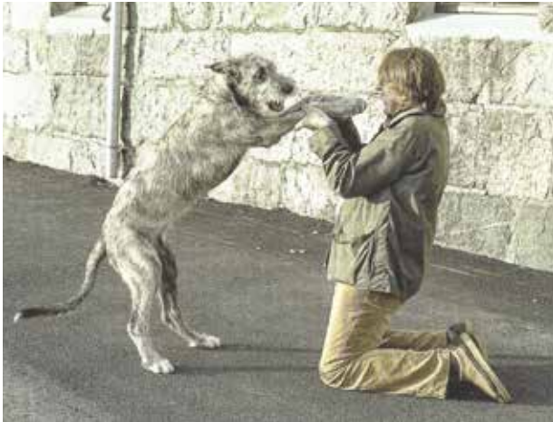
Er så GLAD for at det første kurset er slutt!

”dressøren” - kalte ”psykologiske” metoder, ble ansett som lite effektive. Filosofien var at fravær av smerte skulle gjøre hunden lydlig: rykking i kobbelen er vondt for hunden, ergo må den lære at bare ved å lyde ”his master’s voice” unngår den smerten. På den måten markerte eieren seg hele tida som sjef i forhold til hunden, der tankegangen syntes å være at hunden måtte være undergitt for å være sin eier hengiven.