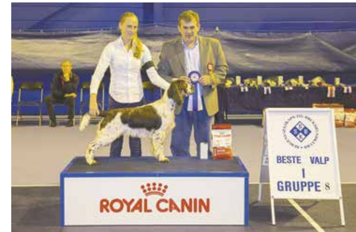
GRUPPE 8 - VALP - Dommer: Vidar Grundetjern, Norge.