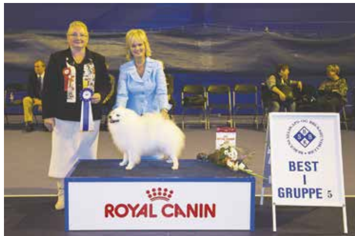
GRUPPE 5 - Dommer: Zorica Salijevic, Sverige.