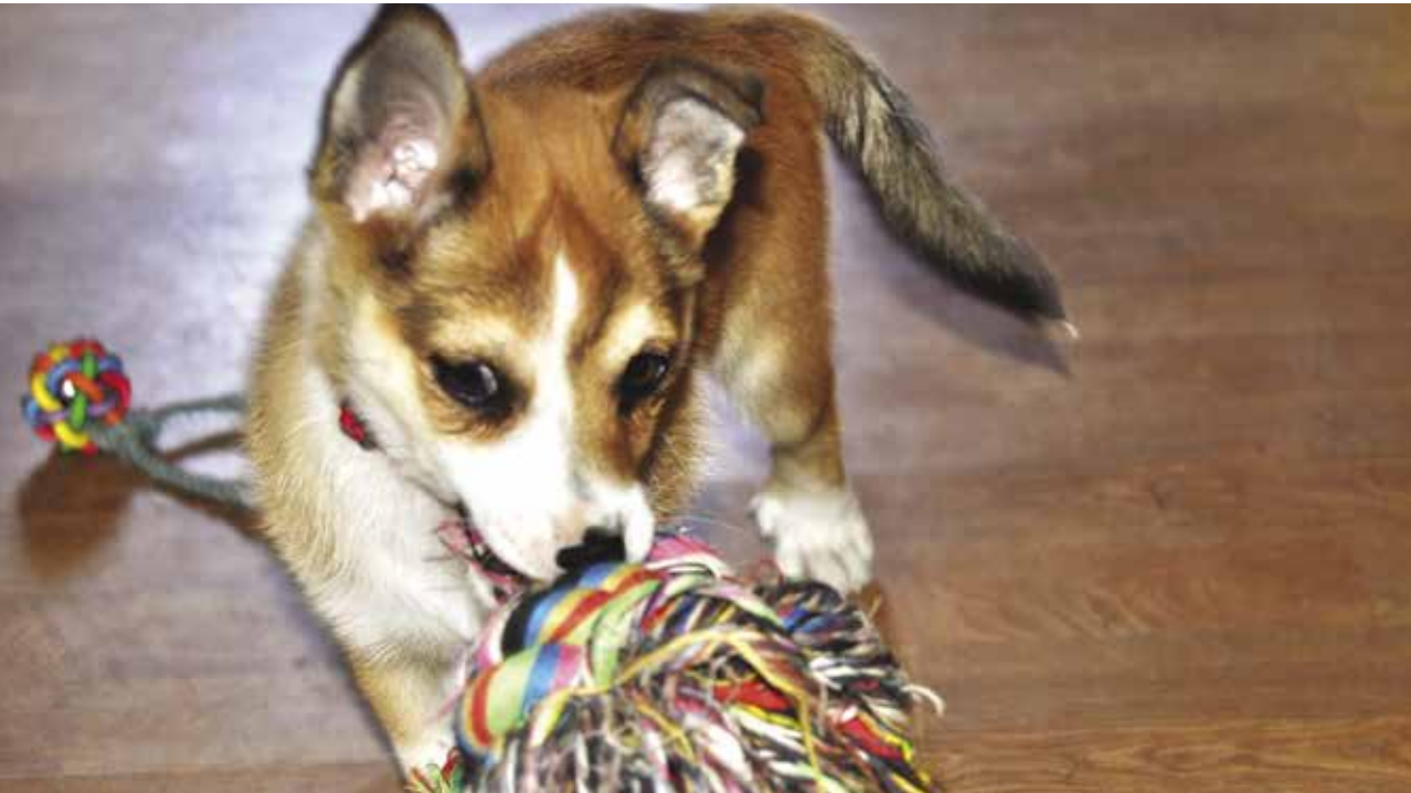
SJARMTROLL: Det er lett å bli sjarmert i senk av en liten valp.

Av Solveig B. Steinnes.