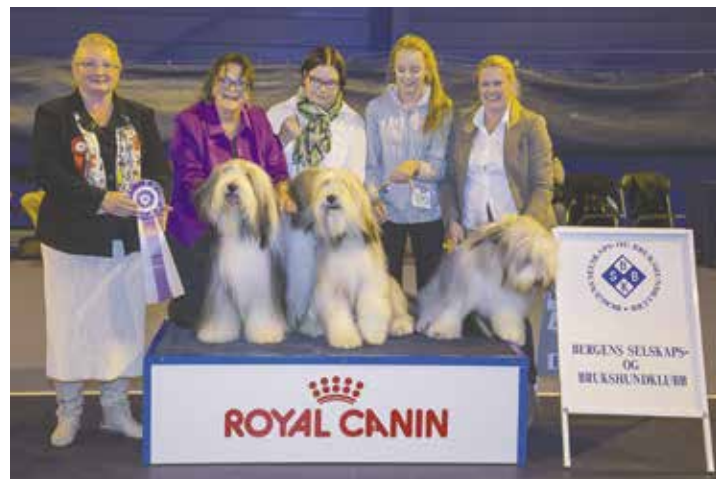
OPPDRETTERKLASSE SØNDAG- Dommer: Zorica Salijevic, Sverige.

KLASSE ELITE – Dommer: Svein G. Rønning, Norge. Det var ingen deltagere som fikk 1. premie.