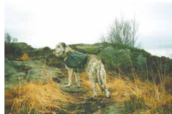
Trapp? Nei takk, heller en steinete skråning-