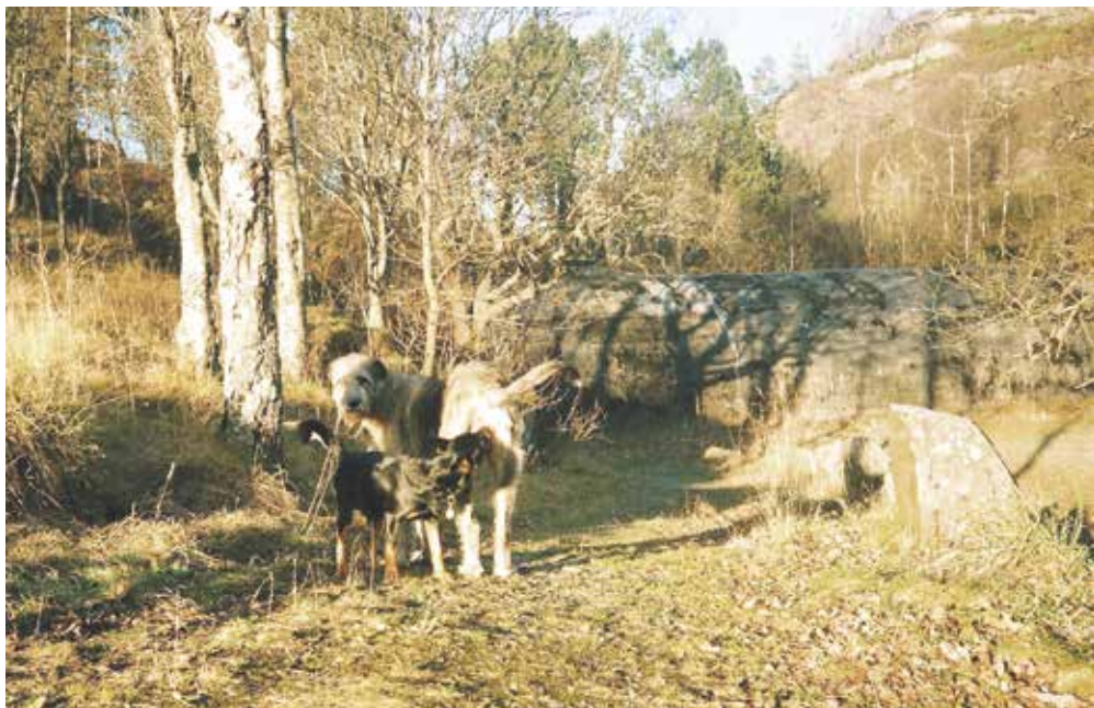
En fredet plett for store og små på to og fire

Det var ingen hunder å leike med denne kvelden. Men for Vige veide nok vårluktene opp, og jeg hadde hatt min stille stund med småfilosofering. Hjemme ventet tørrfiske, et helt lite ritual som avslutning på kveldsturen. Både Vige og matmor var godt fornøyd.