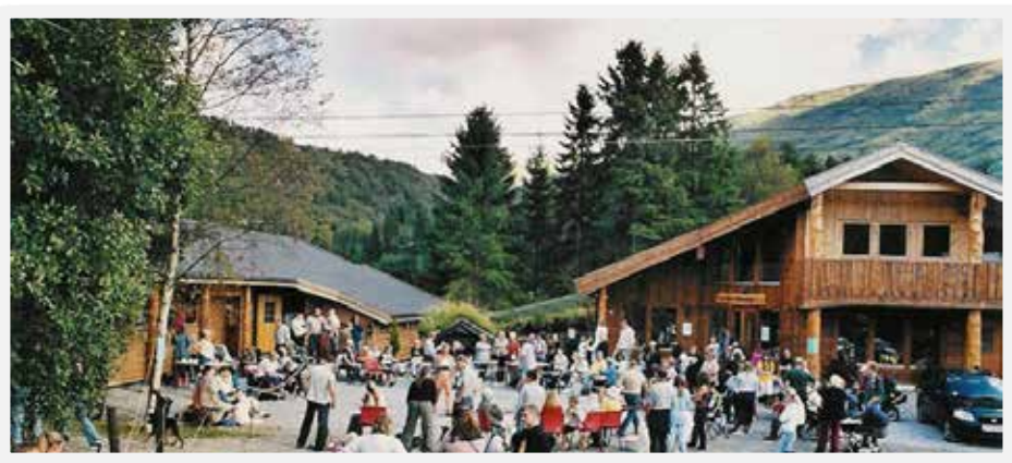
Bildet er fra vår årlige "Åpen Dag"

ALT PÅ ETT STED - KUN 20 MIN FRA BERGEN SENTRUM ET SPENNENDE MILJØ MED HYGGELIG ATMOSFERE - OMSORG MED DYRENE I FOKUS -