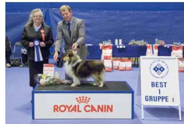
GRUPPE 1 - Dommer: Gunilla Skallman, Sverige.