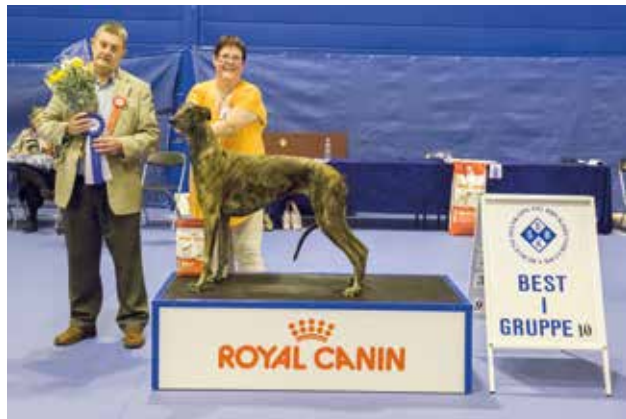
GRUPPE 10 - Dommer: Des Manton, Irland.