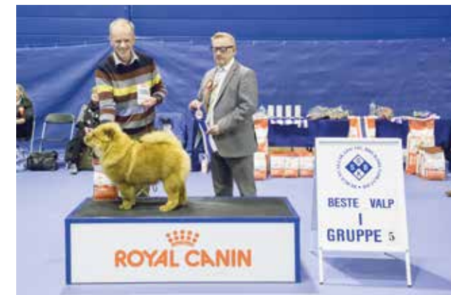
GRUPPE 5 - VALP - Dommer: Svein Bjarne Helgesen, Norge