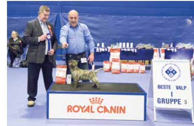
GRUPPE 3 - VALP - Dommer: Des Manton, Irland.