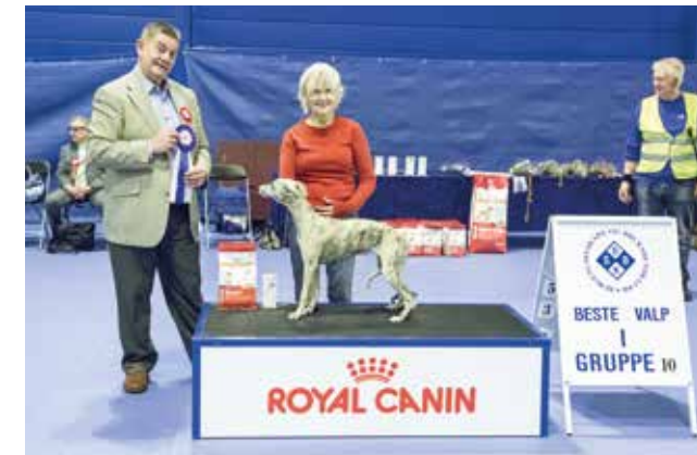
GRUPPE 10 - VALP - Dommer: Des Manton, Irland.