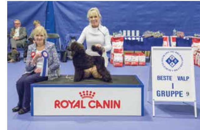
GRUPPE 9 - VALP - Dommer: Modwena Johnston, Irland.