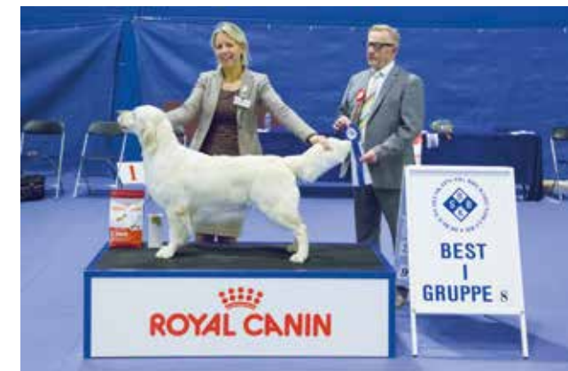
GRUPPE 8 - Dommer: Svein Bjarne Helgesen, Norge