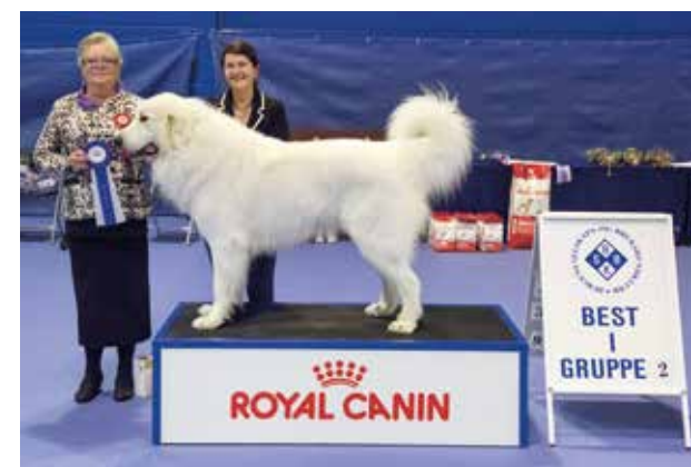
GRUPPE 2 - Dommer: Gunilla Skallman, Sverige.