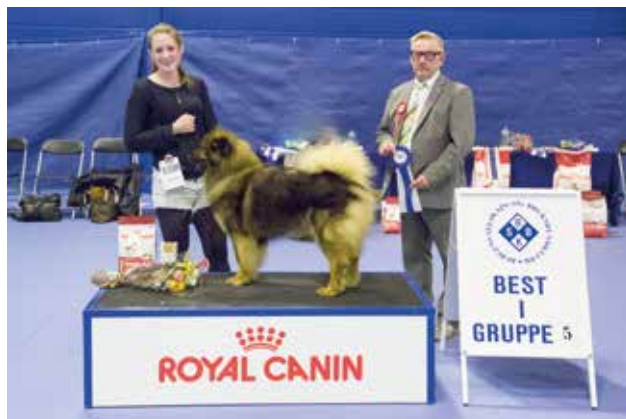
GRUPPE 5 - Dommer: Svein Bjarne Helgesen, Norge.