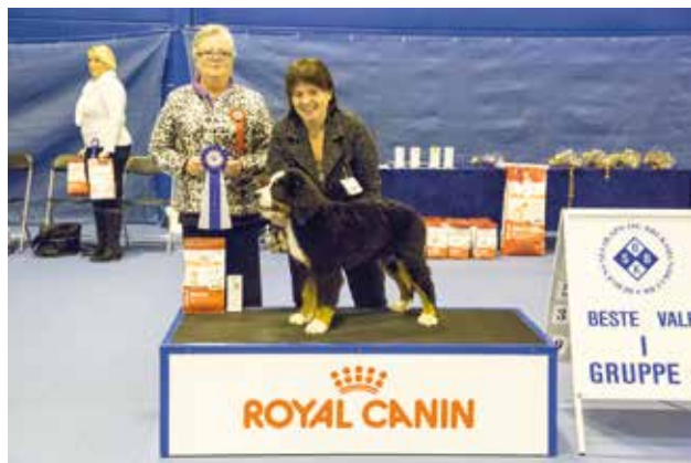
GRUPPE 2 - VALP - Dommer: Gunilla Skallman, Sverige.