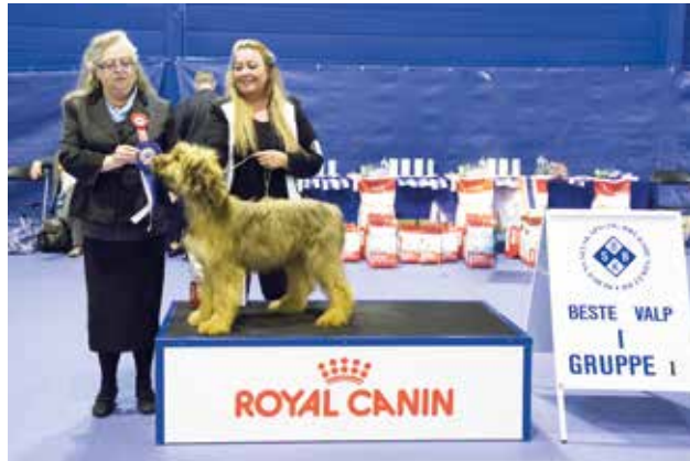
GRUPPE 1 - VALP - Dommer: Gunilla Skallman, Sverige.