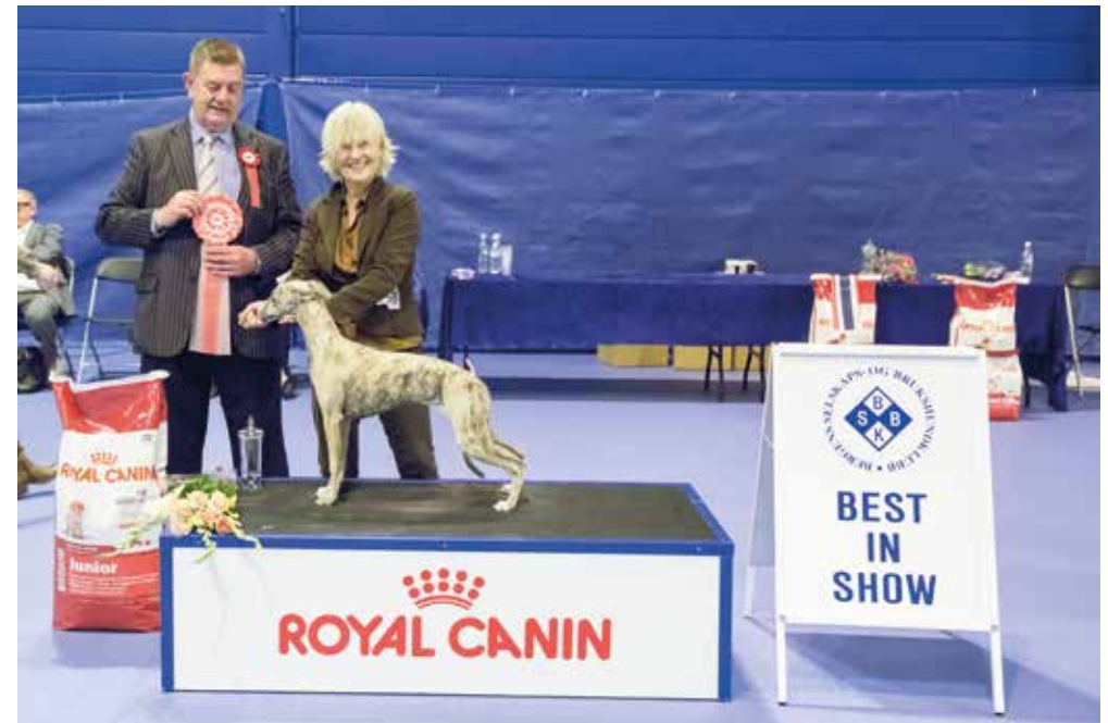
BESTE VALP IN SHOW - Dommer: Des Manton, Irland.