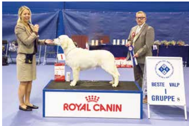
GRUPPE 8 - VALP - Dommer: Svein Bjarne Helgesen, Norge.