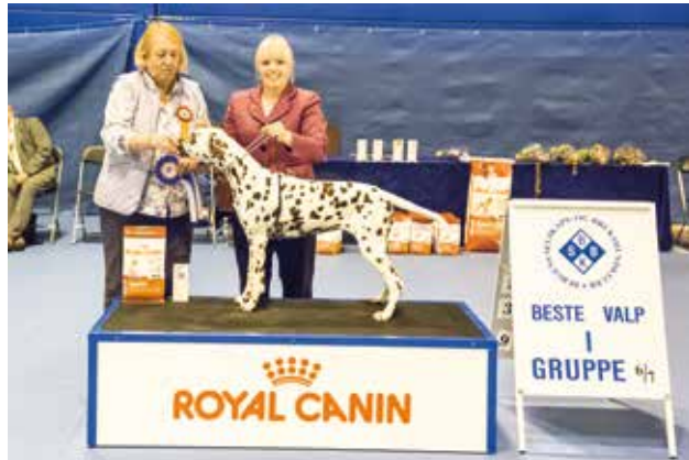
GRUPPE 6/7 - VALP - Dommer: Joyce Crawford Manton, Irland.