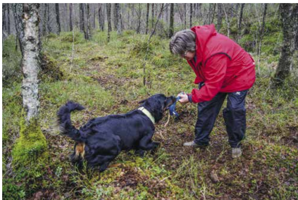
Stemningsbilde fra vårens feltkurs

WAG Familien Aastvedt arne.johan@aastvedt.com Kalvatræet 22, 5106 ØVRE ERVIK Tlf.: 55 18 10 24