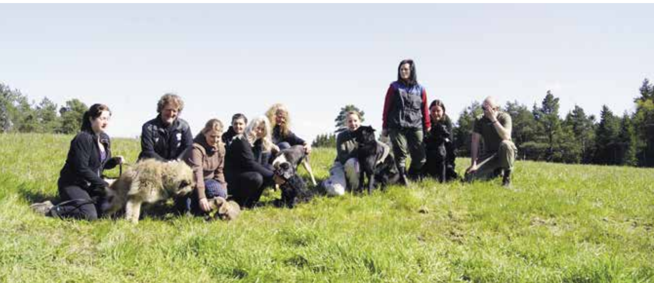
Medlemmer på BSBK-kurs.