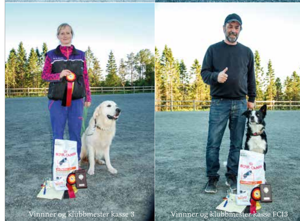
Vinner og klubbmester kasse 3