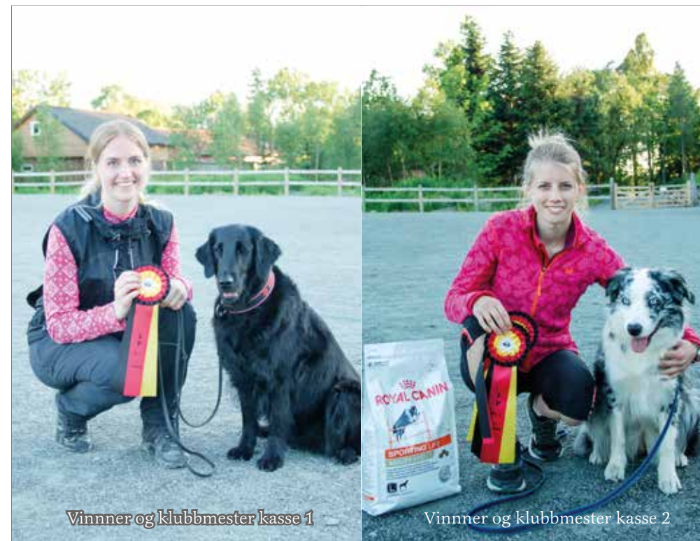
Vinner og klubbmester kasse 1