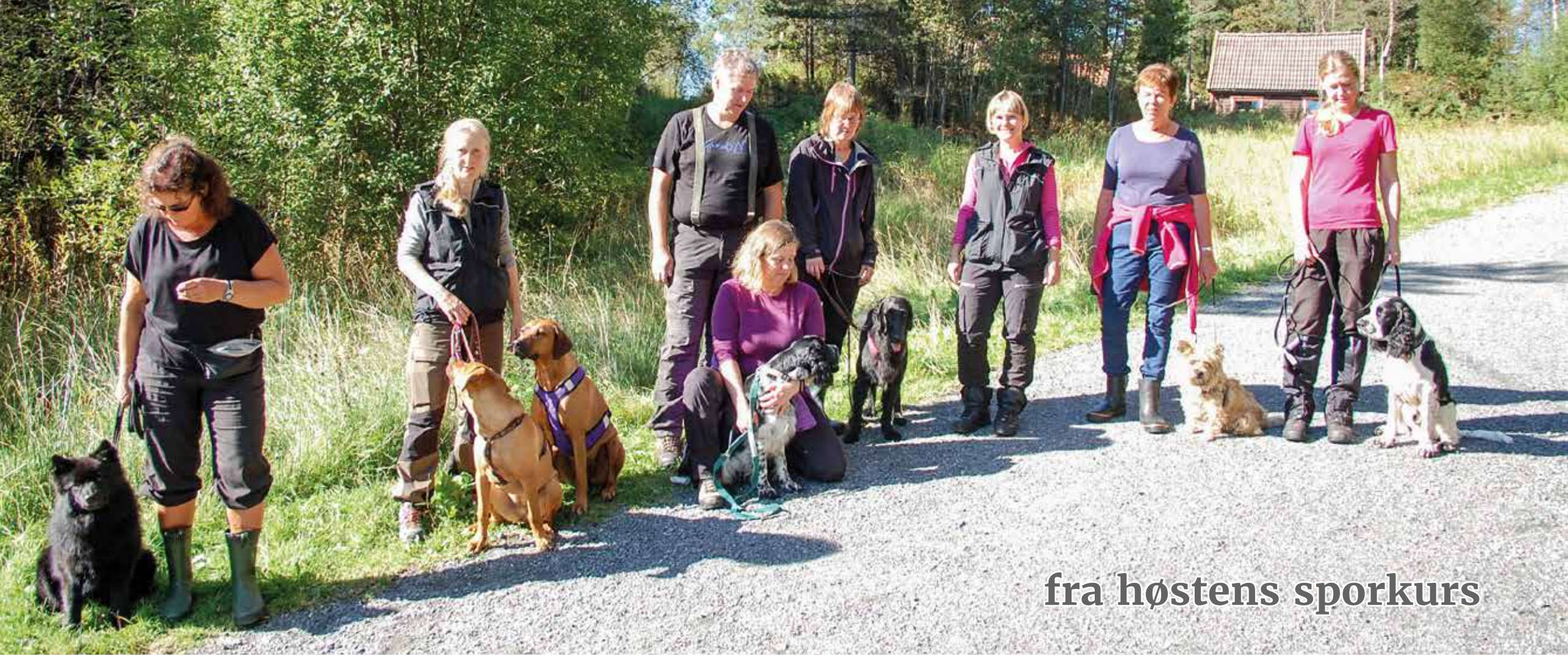
fra høstens sporkurs