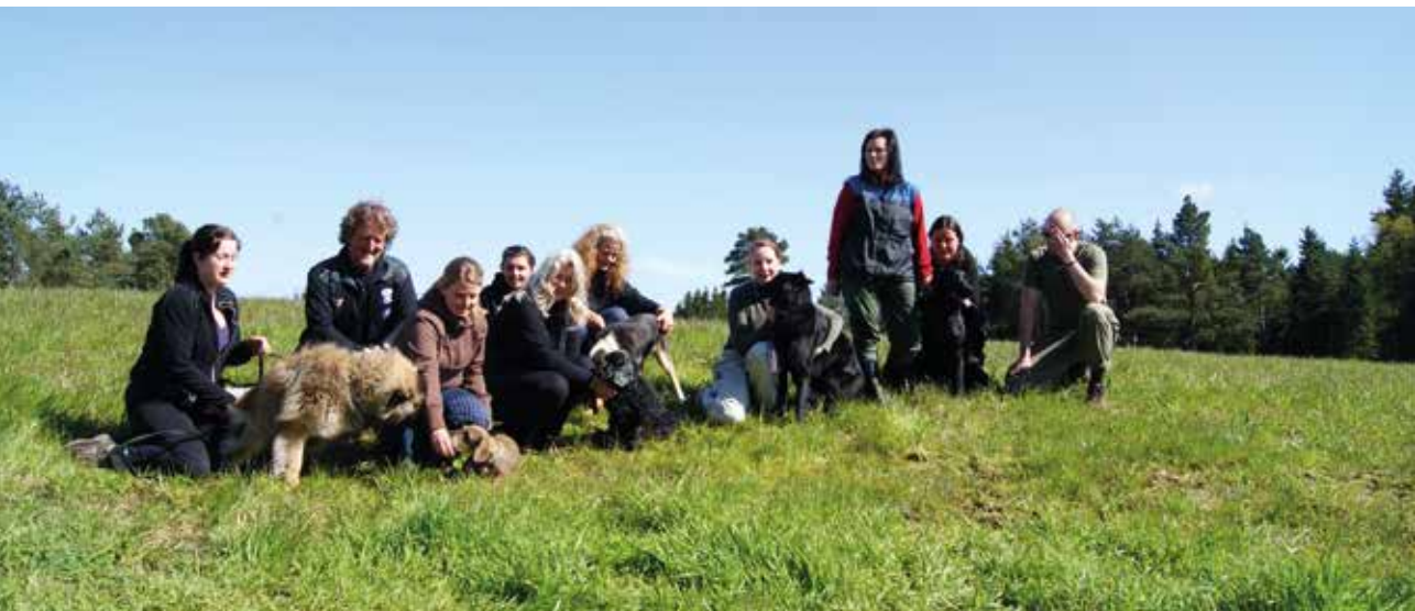
Medlemmer på BSBK-kurs.