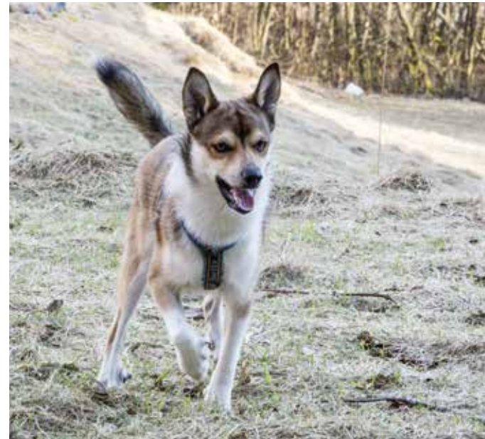
Norsk Lundehund - Ask.

Ifølge Børresen levde lundehund vilt på Værøy. De gule øynene har den fortsatt til felles med ulven. Noen hevder riktig nok at steinalderfolk brakte den til øya. Mer sannsynlig er det at den stammer direkte fra en liten skandinavisk ulvestamme – eller fra en gruppe urhunder – som ble isolert her allerede under istida. Isen nådde nemlig aldri Lofotøyene selv da isbreen var på sitt største for 18 000 år siden. Maten besto av fugl og småvilt. Kampen for å