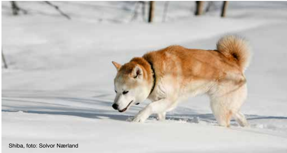
Shiba, foto: Solvor Nærland

Etter at Japan hadde vært isolert fra omverden i noen hundre år, kom det fremmede hunder til landet med utenlandske handelsmenn. Disse ble populære og så oppblandet med de nasjonale hundene at disse etter hvert nesten forsvant som egen type. Da arbeidet med å redde de japanske rasene startet i 1920-årene, måtte man til jegere i bortgjemte og ganske isolerte deler av landet for å få tak i opprinnelige hunder som ikke var blandet med andre hunderaser. Særlig gjaldt det shiba. Dagens shibarase ble på den måten bygget opp av noe ulike varianter av shiba fra tre forskjellige regioner av Japan.