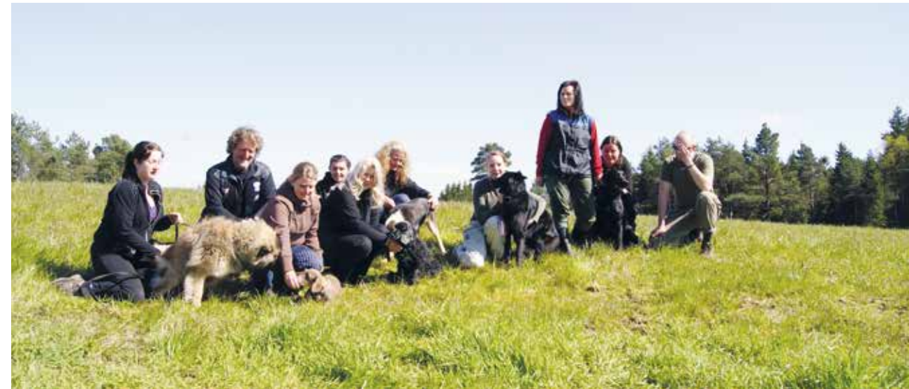
Medlemmer på BSBK-kurs.

Du finner oss på Danmarks plass! Fjøsangerveien 30A, 5053 Bergen