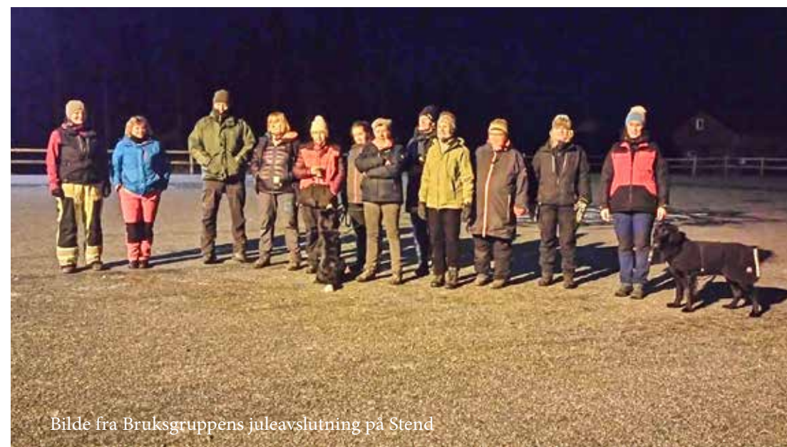
Bilde fra Bruksgruppens juleavslutning på Stend