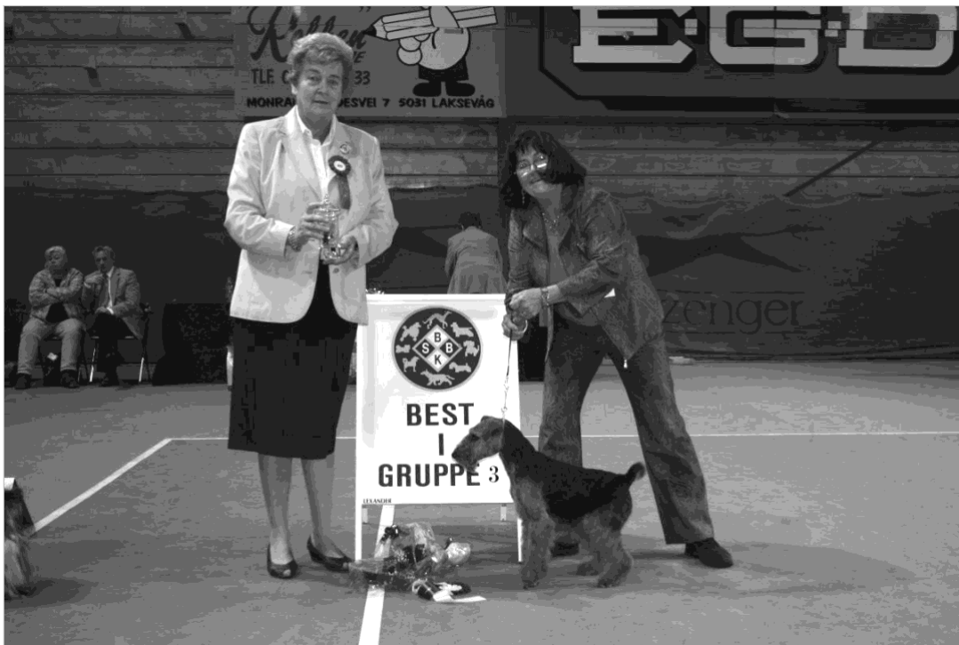
BIS 4. Welsh Terrier - ECCO'S INDIAN BLACK DIAMOND. Eier: Greta Larsen, 1450 Nesoddtangen.