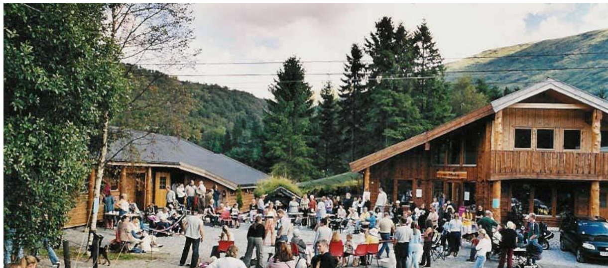
Bildet er fra vår årlige "Åpen Dag"

ALT PÅ ETT STED - KUN 20 MIN FRA BERGEN SENTRUM ET SPENNENDE MILJØ MED HYGGELIG ATMOSFÆRE - OMSORG MED DYRENE I FOKUS -