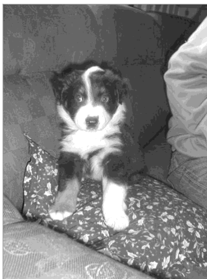
Kennel Vinsti's Adorable Boy (Stompen), bildet tatt i sommer