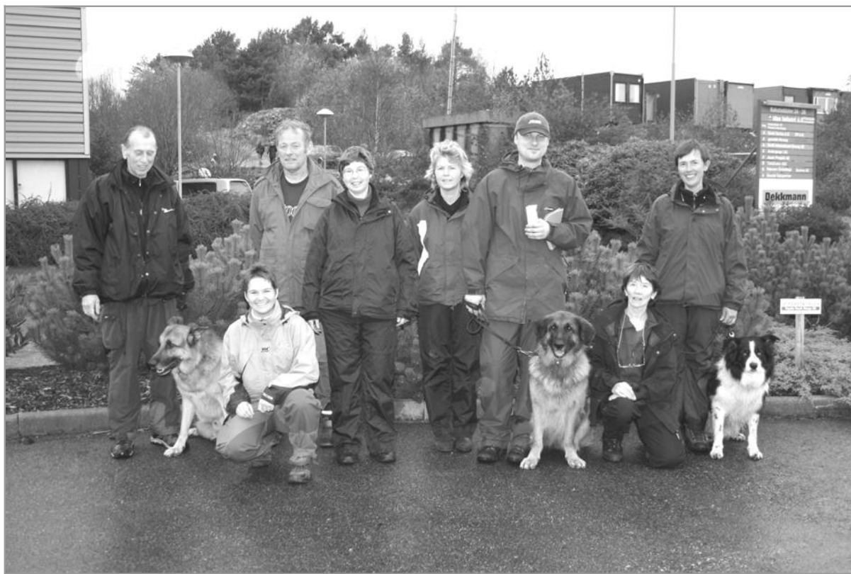
Arrangører og deltakere samlet etter gjennomført mesterskap

KM-spor ble ikke avholdt grunnet kun én påmeldt. Vi håper interessen for spor og rundering vil ta seg opp til neste år.