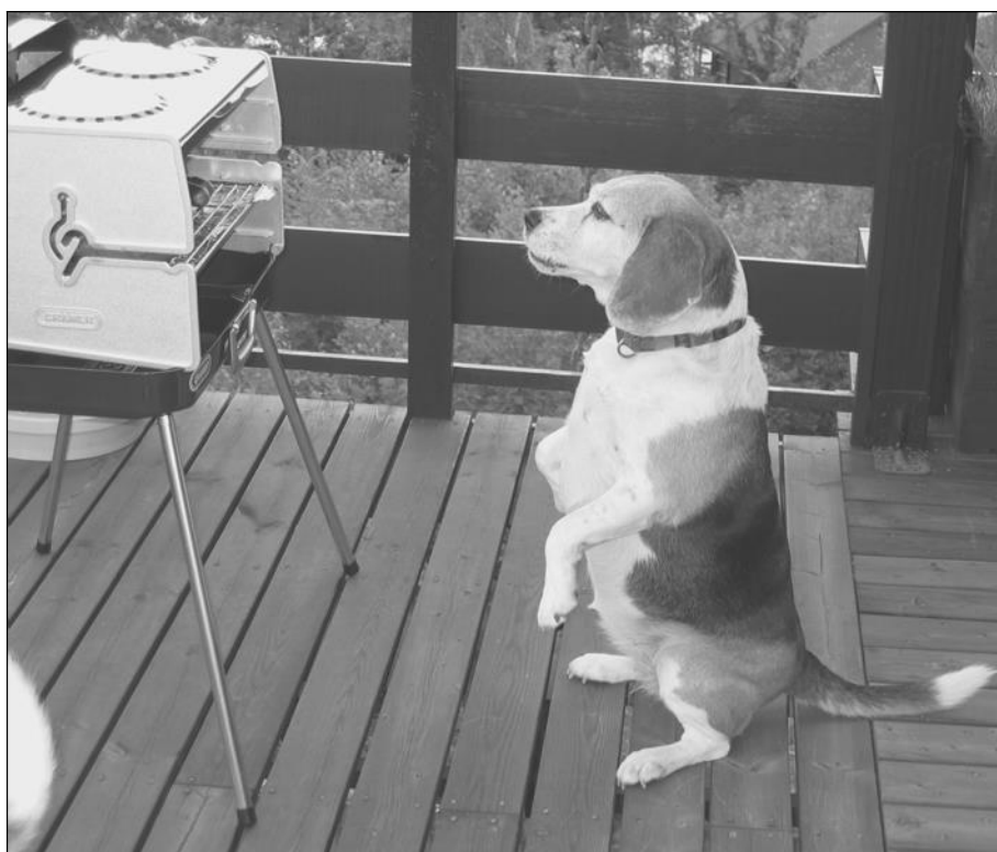
Så var det sommer med grillmat ...