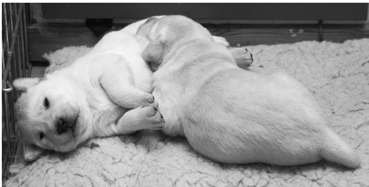
To valper fra Kennel Gullsteinen gir blaffen i fotografen