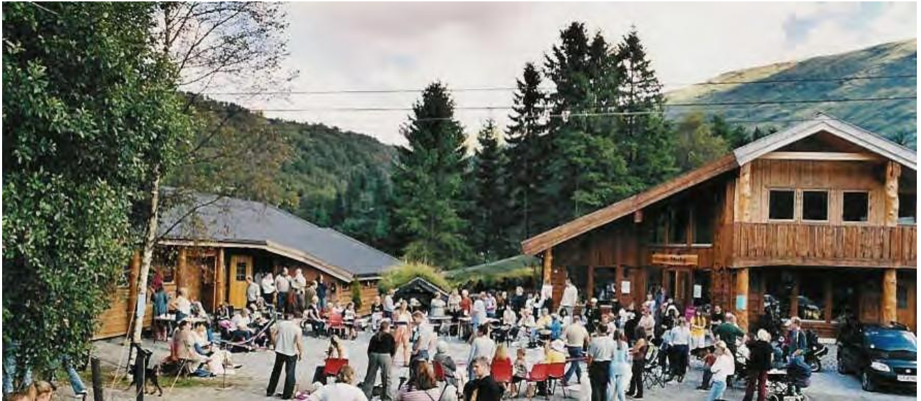
Bildet er fra vår årlige "Åpen Dag"

ALT PÅ ETT STED - KUN 20 MIN FRA BERGEN SENTRUM ET SPENNENDE MILJØ MED HYGGELIG ATMOSFÆRE - OMSORG MED DYRENE I FOKUS -