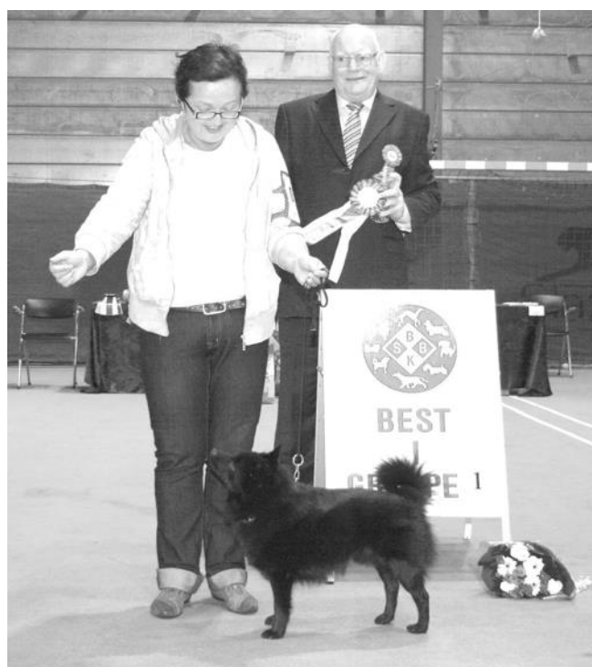
2. Schipperke - N UCH KAJTELAS REX. Eier: Ingrid Løseth Bøe, 5223 Nesttun.