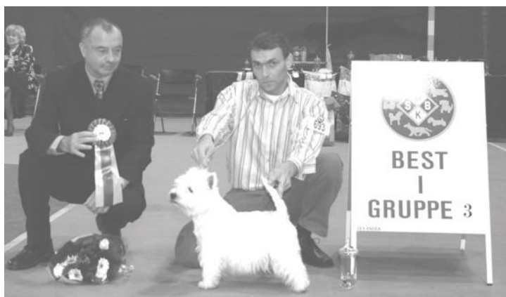
3. West Highland White Terrier - N UCH BELLEVUE PRECIOUS TINA. Eier: Aina Ekornrud, 5576 Øvre Vats.