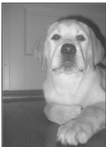
Gullsteinens Living Doll, f. 150406.

Familien Aastvedt Kalvatræet 22 5106 ØVRE ERVIK Tlf.: 55 18 10 24