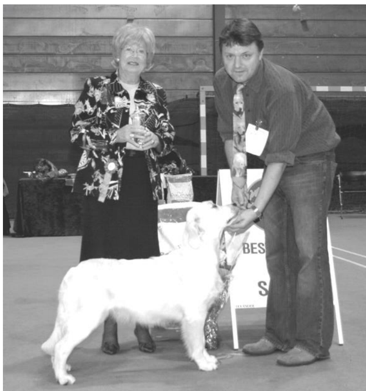
1. Golden Retriever - ZENANAS POLYXENA. Eier: Børge Espeland, 4330 Ålgård.

BESTE VALP IN SHOW - Dommer: Margaret Everton, England.