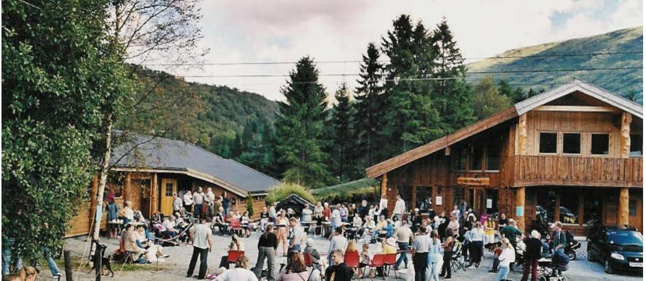
Bildet er fra vår årlige "Åpen Dag"

ALT PÅ ETT STED - KUN 20 MIN FRA BERGEN SENTRUM ET SPENNENDE MILJØ MED HYGGELIG ATMOSFÆRE - OMSORG MED DYRENE I FOKUS -