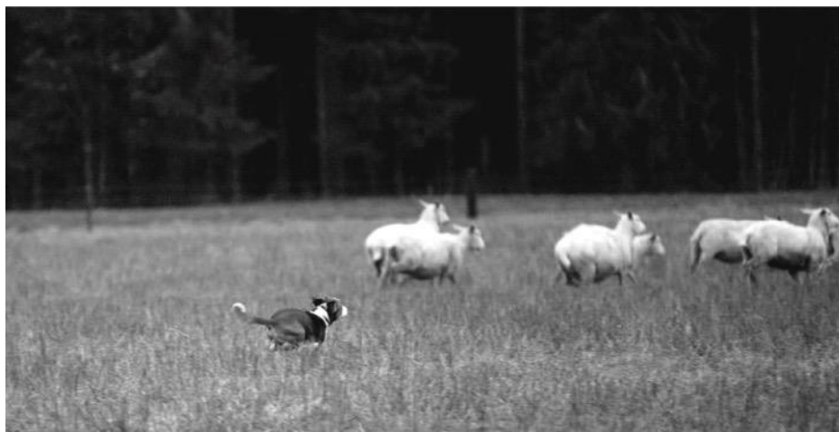
Ingen ønsker vel å oppleve sin egen hund i en slik situasjon