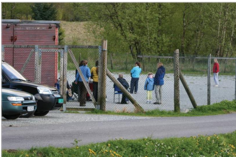
Bilde fra Bruksgruppens treningsbane ved Myrbø Dyresenter på Espeland

KVALITET, SOLID ERFARING OG GOD SERVICE!