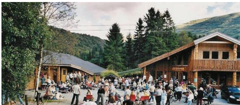
Bildet er fra vår årlige "Åpen dag"

ALT PÅ ET STED - KUN 20 MIN FRA BERGEN SENTRUM ET SPENNENDE MILJØ MED HYGGELIG ATMOSFERE - OMSORG MED DYRENE I FOKUS -