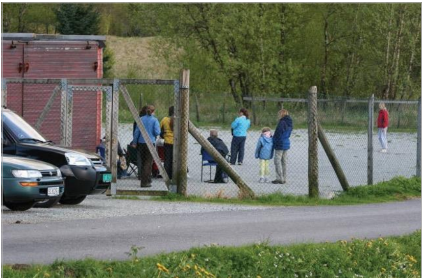
Bilde fra BSBK Bruksgruppens treningsbane ved Myrbø Dyresenter på Espeland

KVALITET, SOLID ERFARING OG GOD SERVICE!