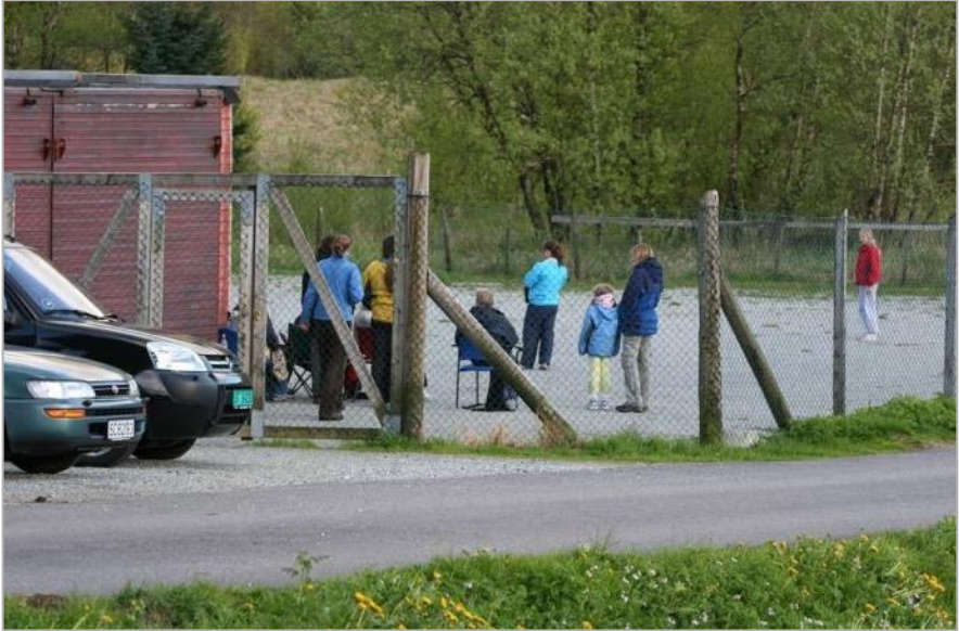
Bilde fra BSBK Bruksgruppens treningsbane ved Myrbø Dyresenter på Espeland

Felles organisert lydighetstrening drives på Myrbø fra kl 19:00 til ca 20:00. Banen er tilgjengelig for BSBK-medlemmer 1800-2200 for egentrening. Banen skal kun benyttes til trening.