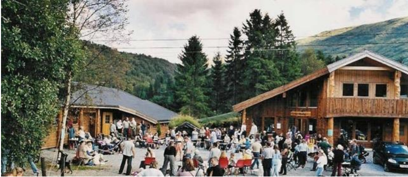
Bildet er fra vår årlige "Åpen dag"

ALT PÅ ET STED - KUN 20 MIN FRA BERGEN SENTRUM ET SPENNENDE MILJØ MED HYGGELIG ATMOSFERE - OMSORG MED DYRENE I FOKUS -