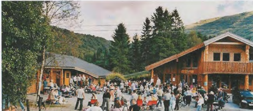
Bildet er fra vår årlige "Åpen dag"

ALT PÅ ETT STED - KUN 20 MIN FRA BERGEN SENTRUM ET SPENNENDE MILJØ MED HYGGELIG ATMOSFÆRE - OMSORG MED DYRENE I FOKUS -