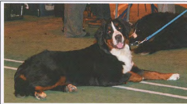
En av de mange tilskuerne som koste seg på Bønesutstillingen i slutten av september