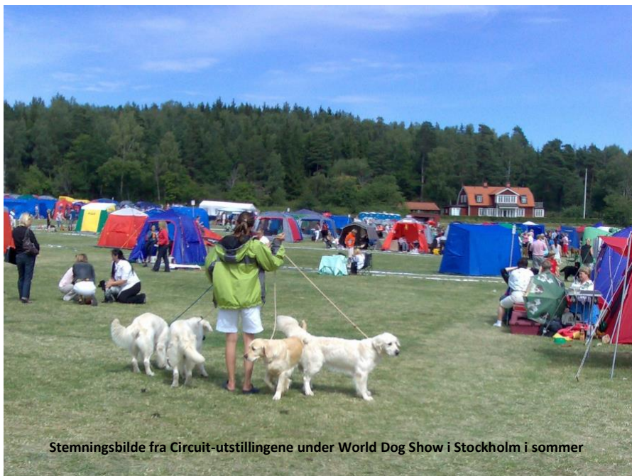
Stemningsbilde fra Circuit-utstillingene under World Dog Show i Stockholm i sommer