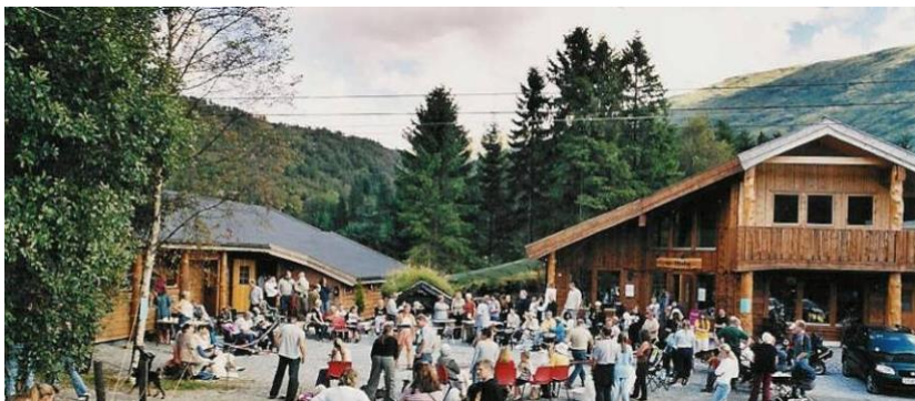
Bildet er fra vår årlige "Åpen dag"

ALT PÅ ETT STED - KUN 20 MIN FRA BERGEN SENTRUM ET SPENNENDE MILJØ MED HYGGELIG ATMOSFÆRE - OMSORG MED DYRENE I FOKUS -