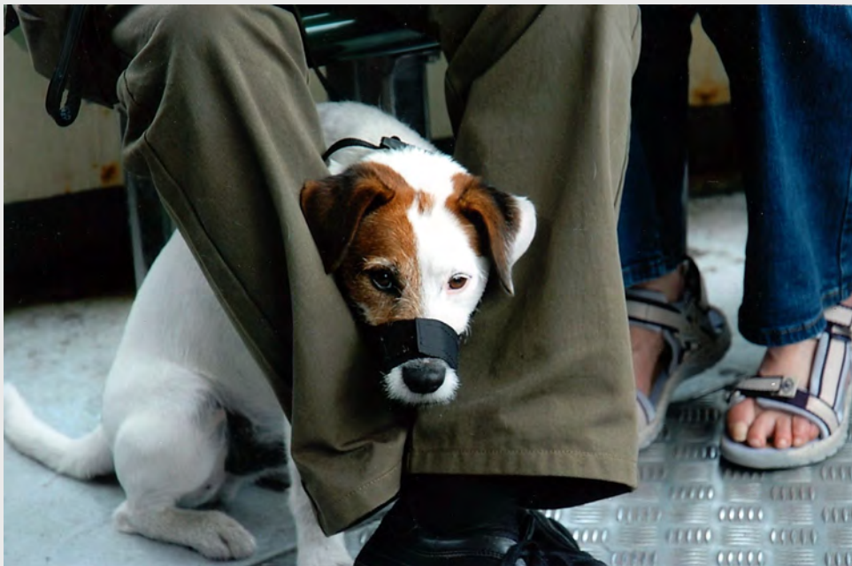
Terrier på båten. Snutebånd er obligatorisk når man beveger seg i tett befolket område

Vi hadde en flott uke i Italia og Venezia kan virkelig anbefales en meget vakker og romantisk by!