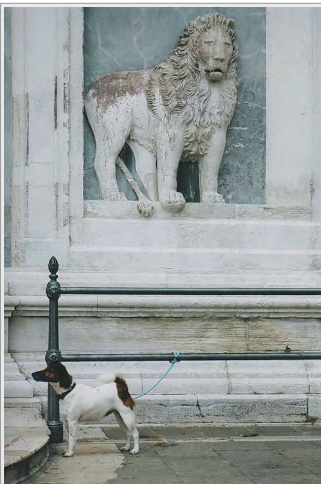
Terrier som passer på løven eller omvendt