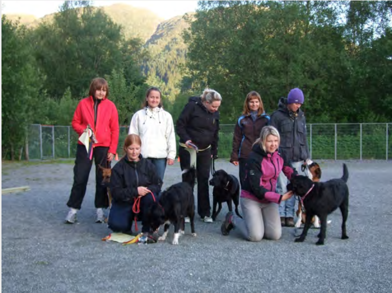
Mange deltakere i LP klasse 1