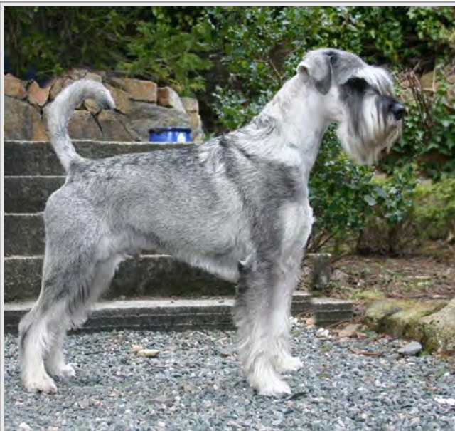
Schnauzer p/s "Uno"