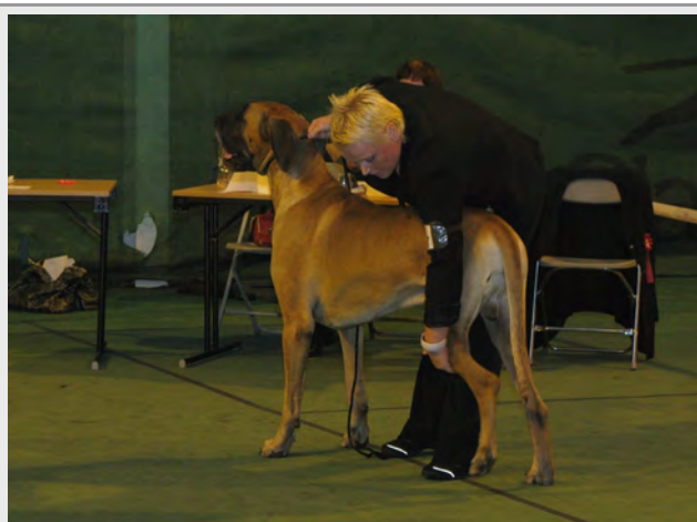
Fra BSBK-utstillingen i september –09

Vi søker seriøse forhandlere – se www.aloevitae.no