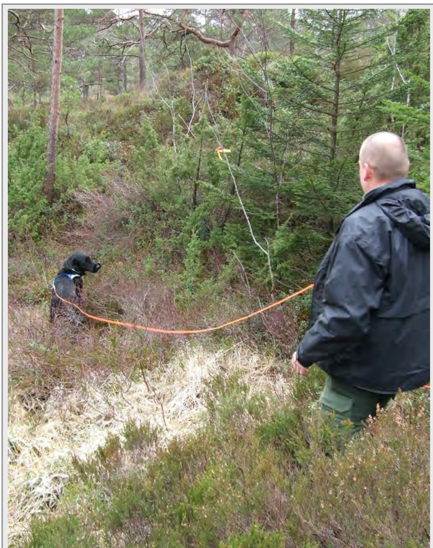
Fra blodsporetning i Hordnesskogen