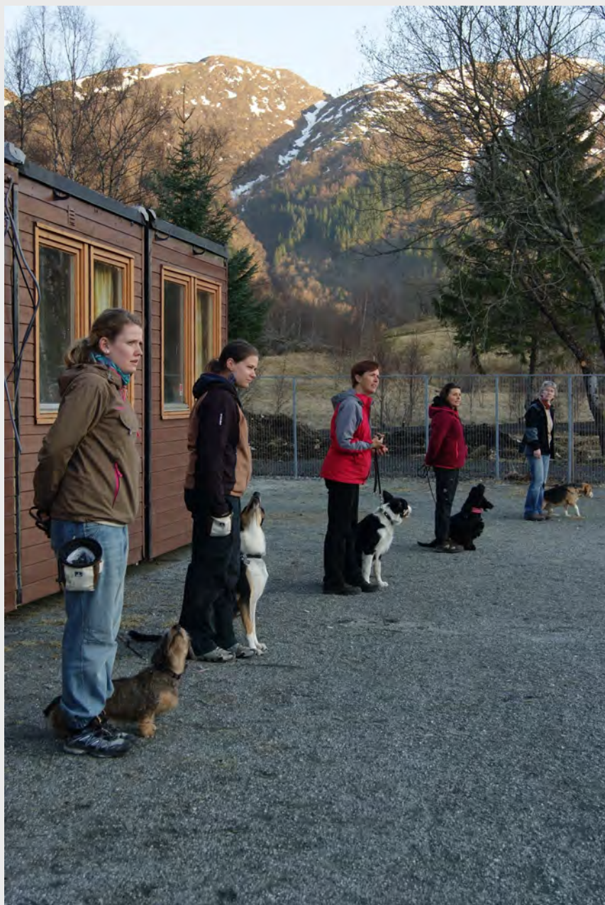
Fra aktivitetstreningen på Myrbø