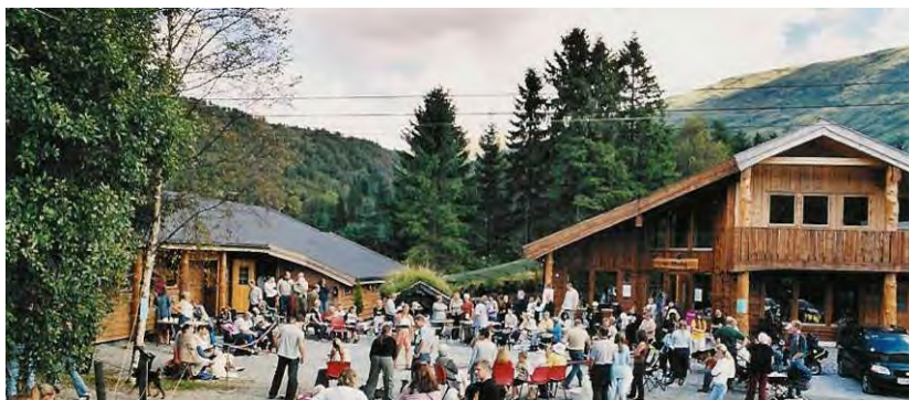
Bildet er fra vår årlige "Åpen dag"

ALT PÅ ETT STED - KUN 20 MIN FRA BERGEN SENTRUM ET SPENNENDE MILJØ MED HYGGELIG ATMOSFÆRE - OMSORG MED DYRENE I FOKUS -