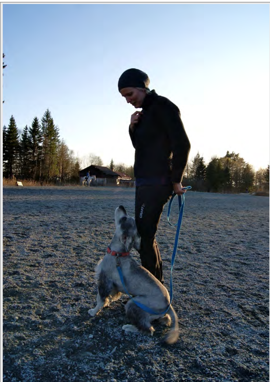
Fra lydighetstreningen på Stend