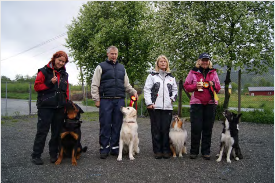
Deltakere i Klubbmesterskapet i lydighet 2010, klasse 1.

Vi ønsker alle ekipasjene lykke til videre!