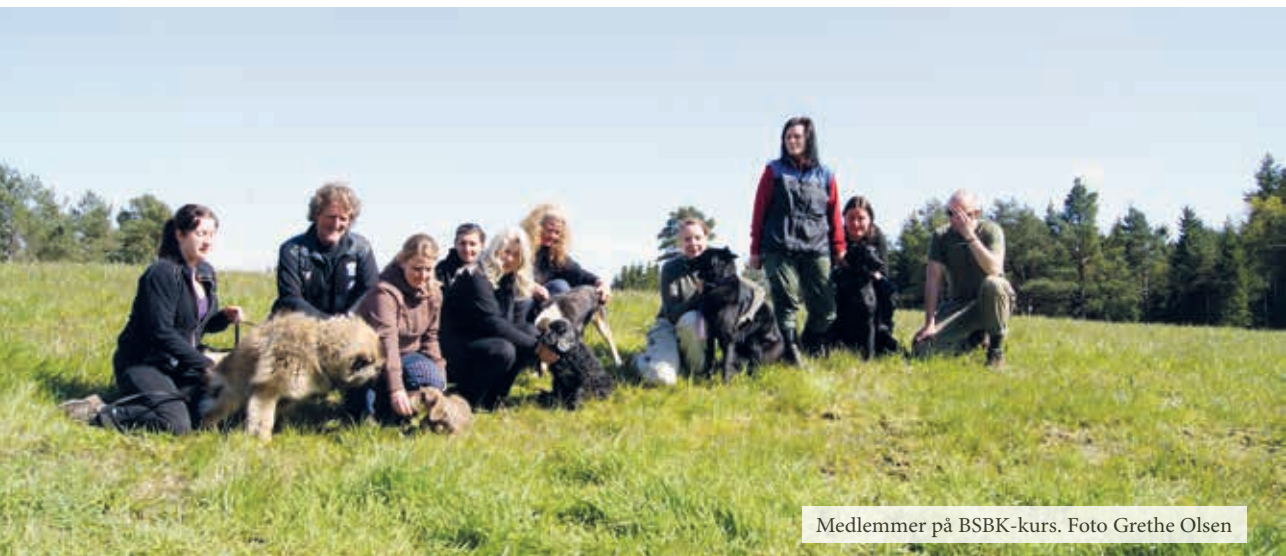
Medlemmer på BSBK-kurs.