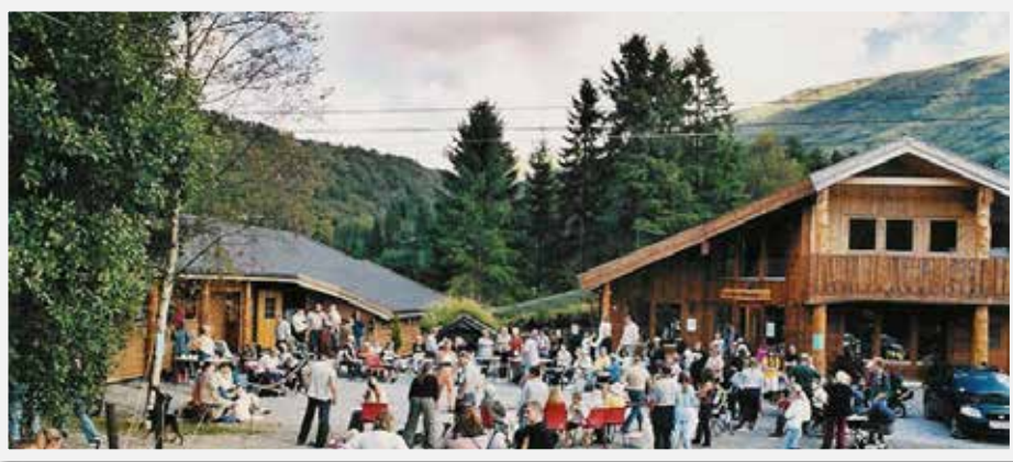
Bildet er fra vår årlige "Åpen Dag"

ALT PÅ ETT STED - KUN 20 MIN FRA BERGEN SENTRUM ET SPENNENDE MILJØ MED HYGGELIG ATMOSFERE - OMSORG MED DYRENE I FOKUS -