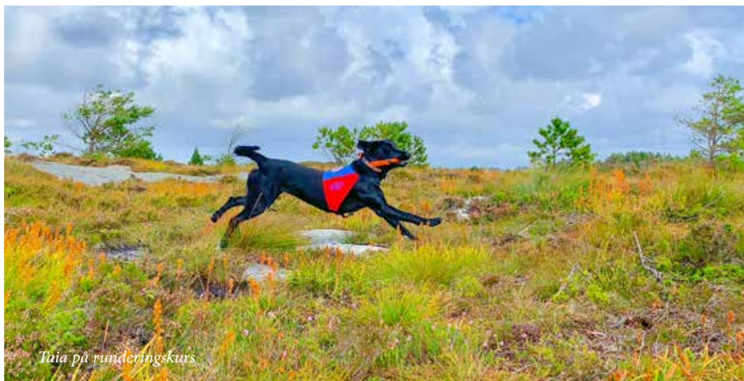
Taia på runderingskurs