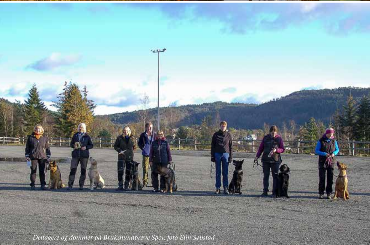
Deltagere og dommer på Brukshundprøve Spor