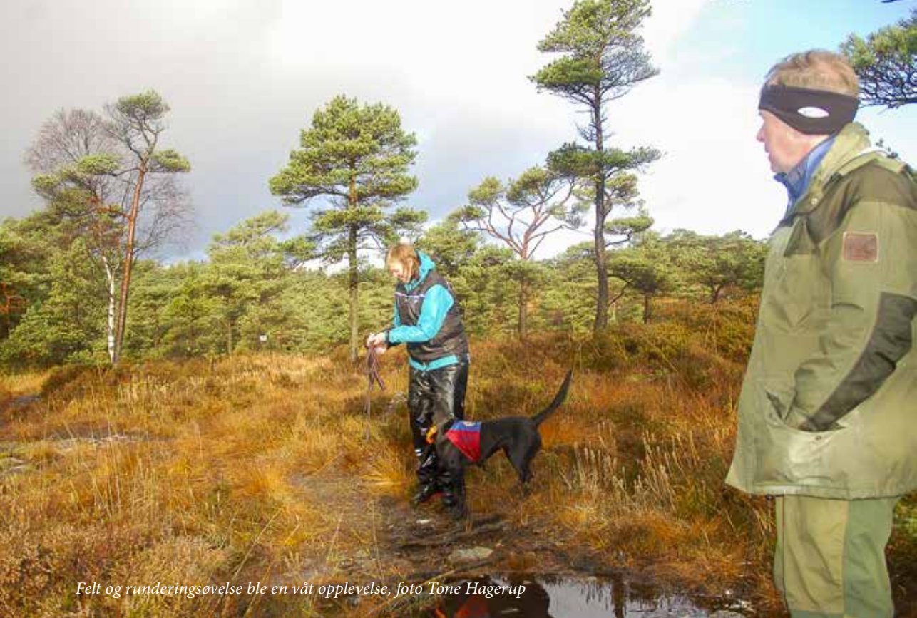
Felt og runderingsøvelse ble en våt opplevelse